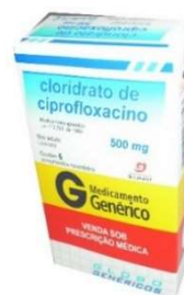
5940-Ciprofloxacino 500mg c/ 14 generico Referência: Cipro