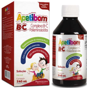
8954-Apetibom B+C 240ml Frutas vermelhas 8954-Apetibom B+C 240ml Chocolate