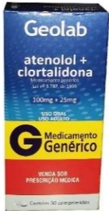
7687-Atenolol+clortalidona 50+12,5mg c/30 8506-Atenolol+clortalidona 100mg+25mg c/30 Referência: Temoretic