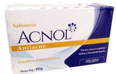
2741- Sabonete de enxofre antiacne 80g