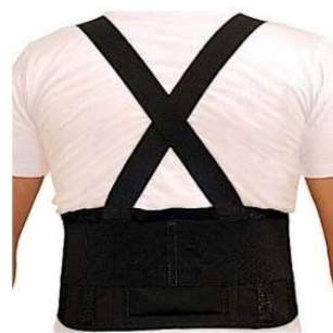
10406-Cinta lombar ergonomica D-414