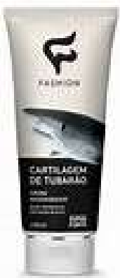
9368- Cartilagem de Tubarão 200ml aerossol 9088- Cartilagem de Tubarão 100ml