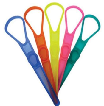
10936-Limpador de língua