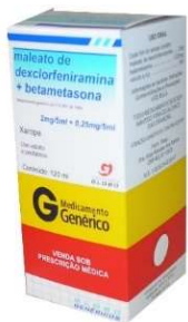
5165-Dexclorfeniramina+ Btametazona 120ml Referência: Celestamine