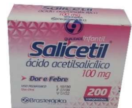
10107-Salicetil 100mg c/200 10108-Salicetil 100mg c/500 Ácido acetilsalicílico Referência: Aspirina