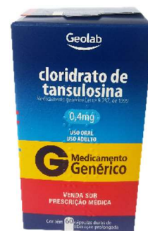
7705-Tansulosina 0,4mg c/20 9754-Tansulosina 0,4mg c/60 5799-Tansulosina 0,4mg c/30 Referência: Cecotex