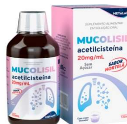
11024-Mucolisil ad 40mg xpe 120mL 11130-Mucolisil inf 20mg xpe 120mL Acetilcisteína