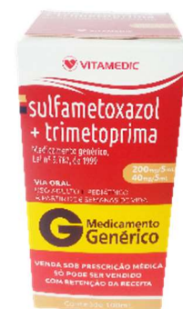
9755-Sulfametoxazol+Trimetoprima 200mg+40mg 100ml Referência: Bactrin