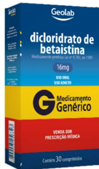
8997-Betaistina 16mg c/30 9036-Betaistina 24mg c/30 Referência: Betaserc