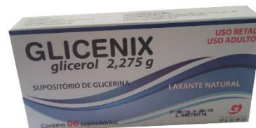
8727-Glicenix ad c/ 6 8728-Glicenix inf c/6 Glicerol Referência: Glicerol