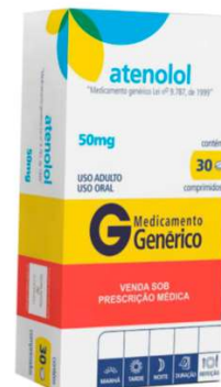
8611-Atenolol 50mg c/30 Referência: Amoxil