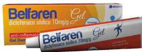
10188-Belfaren 50mg c/20 10189-Belfaren gel 60g Diclofenaco sódico Referência: Voltaren