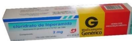
5932-Loperamida 2mg c/200 8130-Loperamida 2mg c/12