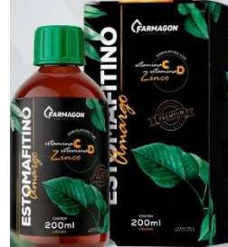
10230-Estomafitino amargo premium (vit D+ zinco) 200ml