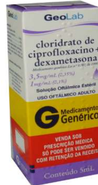
7374-Ciprofloxacino+Dexa. sol. Oftálmica 3,5mg e 1mg 5ml Referência: Biamotil D