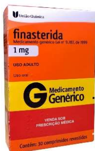
10830-Finasterida 1mg c/30 Referência: Propecia