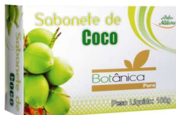
5905- Sabonete de Coco 100g