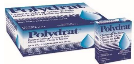
1704-Polydrat env.c/4x27,9g natural 7350-Polydrat env.c/4x28,52g framboesa 7351-Polydrat env.c/4x28,52g guaraná 7352-Polydrat env.c/4x28,52g laranja 7353-Polydrat env.c/4x28,52g uva 1718-Polydrat env.c/50x27,9g natural 7354-Polydrat env.c/50x28,52g framboesa 7355-Polydrat env.c/50x28,52g garaná 7356-Polydrat env.c/50x28,52g laranja 7357-Polydrat env.c/50x28,52g uva Clor potássio, sódio, anidra Referência: Pedialyte