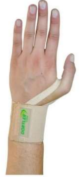
10281-Munhequeira elástica regulável-U D-305 bege