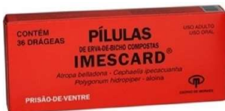
153- Pímulas imscard c/36