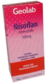
8078-Nisoflan 100mg c/12 8970-Nisoflan gts 15ml Nimesulida Referência: Nisulid