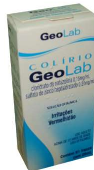
6989-Colírio geolab 20ml Cloridrato de nafazolina+ Sulfato zinco Heptaidratado Referência: Moura Brasil