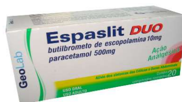
7056-Espaslit Duo c/20 Butilbrometo de Escopolamina+Paracetamol Referência: Buscopan Plus