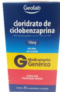
8931-Ciclobenzaprina 10mg c/30 8940-Ciclobenzaprina 5mg c/30 Referência: Miozan