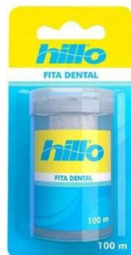
4971Fita dental 100m 10989-Fita dental leve 125m pague 100m