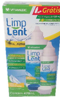
9758-Limp lente sol.p/lentes contato 470ml