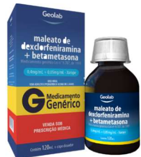
8353-Dexclorfeniramina+ Betametasona 120ml Referência: Celestamine