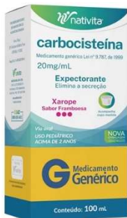
9494-Carbocisteína ad 100ml 9493-Carbocisteína inf 100ml Referência: Mucolitic