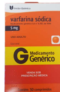
10478-Varfarina sódica 5mg c/30 Referência: Merevan