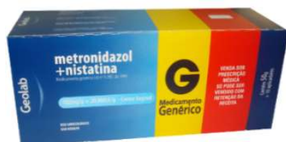
8254- Metronidazol+Nistatina Cr vg 50g+10ap 8736- Metronidazol gel vg 50g+10ap Referência: Flagyl