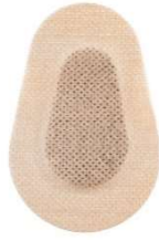
11101- Protetor ocular c/12 HC664 Multilaser