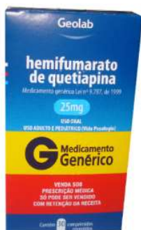
8757-Quetiapina 100mg c/30 8303-Quetiapina 25mg c/14 8304-Quetiapina 25mg c/30 Referência: Seroquel