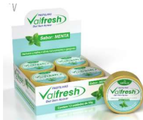
11044-Pastilha Valfresh diet 50g display c/12x60