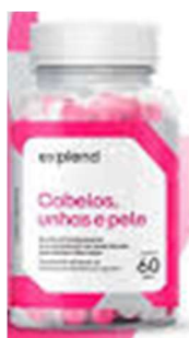
10961-Vitamina cabelos unhas e pele 500mg c/60 caps Explend