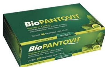
5830-Biopantovit flaconete c/60x10ml 6063-Biopantovit 150 ml BOLD