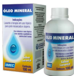
9477-Óleo Mineral 100ml 9948-Óleo Mineral 100ml sabor laranja