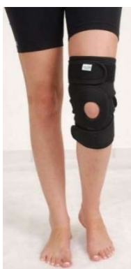
10270-Joelheira c/orifício e sup.patelar ajust. U D-645