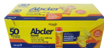
11218-Abcler flac c/50 Airela