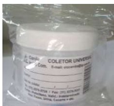
1296 -Pote universal c/100