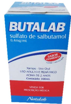
9704-Butalab 100ml Salbutamol Referência: Aerolin