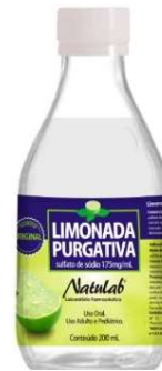
5113- Limonada purgativa 200ml