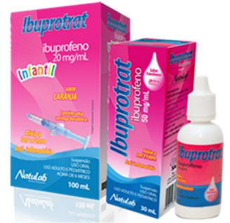
6267-Ibuprotrat inf laranja 30ml+seringa 5112-Ibuprotrat framboesa gts 30ml Referência: Dalsy