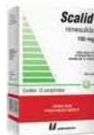
10739-Scalid 100mg c/12 Nimesulida Referência: Nisulid