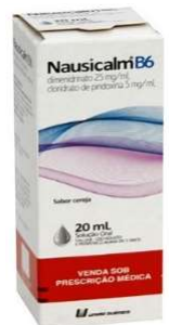
10737-Nausicalm B6 5mg gts 20ml Referência: Dramin