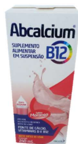
3855-Abcalcium b12 240ml Airela