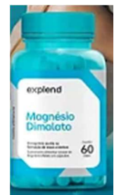
11048-Magnésio dimalato c/60 caps Explend