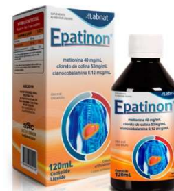
11022-Epatinon 120mL Referência: Xantinon