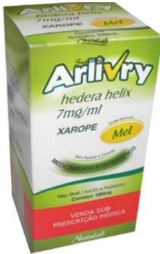
6515-Arlivry100ml cereja 8190-Arlivry100ml cereja c/seringa 8159-Arlivry100ml Mel c/seringa 6516-Arlivry100ml Mel Hedera Helix Referência: Abrilar