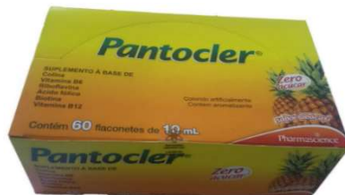
8772-Pantocler (abacaxi) c/60x10 ml