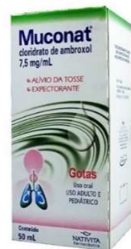
4015-Muconat Menta Ad 120ml 4016-Muconat Framboesa Inf 120ml 3521-Muconat gts 50ml Cloridrato de Ambroxol Referência: Mucosolvan