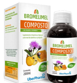
10807-Xarope bromelime de assapeixe 150ml