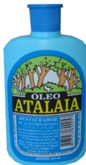
7549-Óleo atalaia 120ml