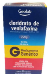
9465-Venlafaxina 150mg c/30 9913-Venlafaxina 37,5mg c/30 9403-Venlafaxina 75mg c/30 Referência: Venlaxin