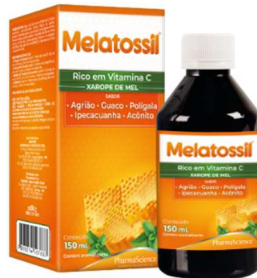
4073-Melatossil mel e agrião 150ml