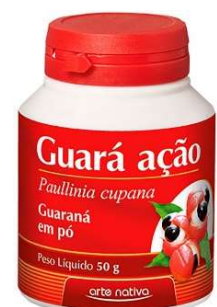
4533-Guaraná ação caps. 500mg c/30 4534-Guaraná ação pó 50g