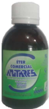
5448-Éter 100ml Antares