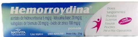
5737- Hemorroydina pda 25g Referência: Hemovirtus