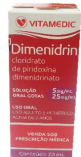
7200- Dimenidrin gts 20ml Clor. Piridoxina+dimen. Referência: Dramin