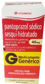
9756- Pantoprazol 40mg c/28 Referência: Zestril