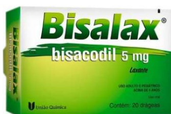
10684-Bisalax 5mg c/20 Bisacodil Referência: Lacto Purga