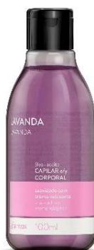
10785-Óleo capilar e corporal lavanda 100ml