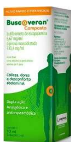
10482-Buscoveran gts 10ml Escopolamina+Dipirona Referência: Buscopan Composto