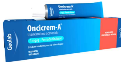
6145-Oncicrem-A pda 10g Acet. Triancinolona Referência: Oncilon-A orabase