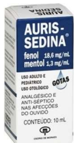
150- Auris-sedina Fenol+mentol