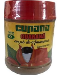
168-Guaraná em pó 80g