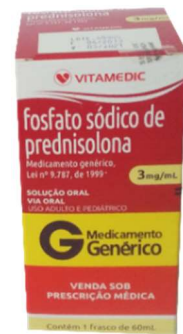
9681-Prednisolona 120ml 9680-Prednisona 60ml Referência: Prelone