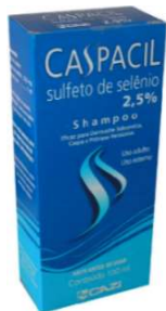
3781-Caspacil 2,5% xpu 100ml Sulfeto de selênio