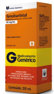
10793-Fenobarbital 40mg 20ml 10794-Fenobarbital 100mg c/30 Referência: Gardenal