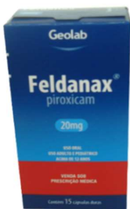
8376-Feldanax 20mg c/15 Piroxicam Referência: Feldene