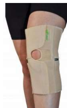
10288-Joelheira elástica M D-527