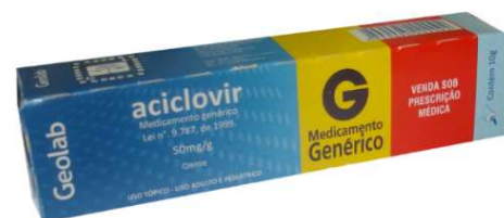
6417-Aciclovir creme 10g Referência: Zovirax