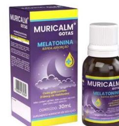
11027-Melatonina muricalm gts 30mL 11026-Melatonina+maracujá xpe 120mL