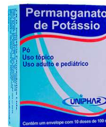
9179-Permanganato de potássio c/50x10 pó 10330-Permanganato de potássio c/30x10 pó Uniphar