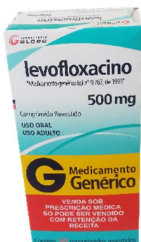
9762-Levofloxacino 500mg c/10 10345-Levofloxacino 500mg c/7 Referência: Tavanic