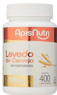
8969-Levedo de cerveja c/400