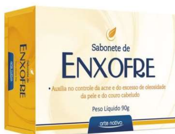
10436-Sabonete de glicerina 90g