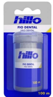
2054-Fio dental 100m 2055-Fio dental extra fino 100m 10987-Fio dental extra fino leve 125m pague 100m 10988-Fio dental leve 125m pague 100m