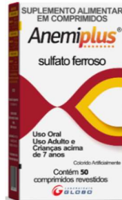
10625-Anemiplus c/50 10627- Anemiplus gts 30ml Sulfato ferroso