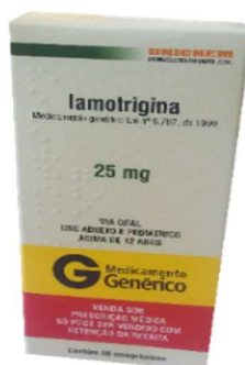
9404-Lamotrigina 100mg c/30 9405-Lamotrigina 25mg c/30 9406-Lamotrigina 50mg c/30 Referência: Lamictal