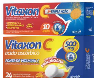
1593-Vitamina C 500mg c/24 2380-Vitamina C 20ml 10149-Vitamina C trilha ação eferv c/10 3862-Vitamina C eferv 1g c/10 10157-Vitamina C + zinco eferv c/10 Ácido ascórbico Referência: Cebion