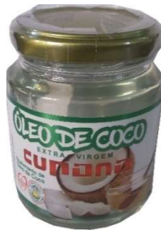
10177-Óleo de coco 200ml