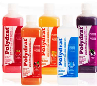
Polydrat 450ml 3253-laranja 3251-natural 3254-uva 3252-framboesa 4511-guaraná 5013-cola 9538-coco 3539-maçã Clor potássio, sódio, anidra Referência: Pedialyte