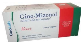
6759-Gino Mizonol cr vag 80mg c/14 aplicadores Referência: Daktarin