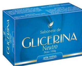
3415-Sabonete de glicerina 100g