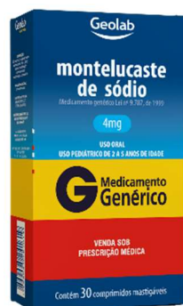
9364-montelukaste 4mg c/30 9365-montelukaste 4mg c/30 Referência: singularir