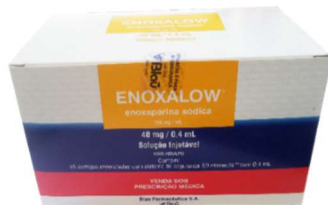
9471-Enoxalox 20mg c/10 inj. 9198-Enoxalox 40mg c/10 inj. 9486-Enoxalox 60mg c/10 inj. 10205-Enoxalox 80mg c/10 inj. Enoxaparina sódica Referência: Clexane