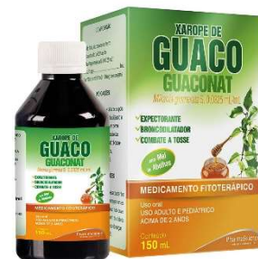
6104-Xrope guaconat guaco e mel 150ml