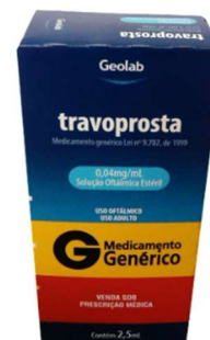
8437-Travoprost sol oft 0,04mg/ml 2,5ml Referência: Travatan