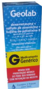
8211-Dexametasona+Neomicina+ Polimixina B susp. Oftálmica 5ml Referência: Maxitrol