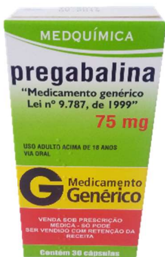
9280-Pregabalina 75mg c/30 Referência: Lyrica