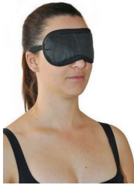
10280-Mascara nylon para descanso-U D-700