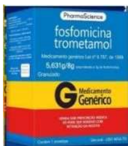
10710-Fosfomicina trometamol c/1 envelope