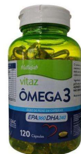
7414-Ômega 3 c/120 caps