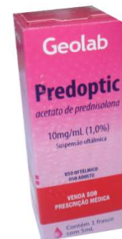
8213-Predoptic sol oftálmica 10mg 5ml Acet. Prednisolona Referência: Allergan