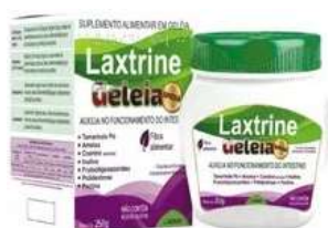
10583-Laxtrine geleia ameixa 250g Referência: Tamarine