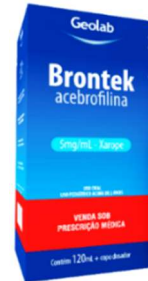
6143-Brontek ad 120ml 6144-Brontek inf 120ml Acebrofilina Referência: Brondilat