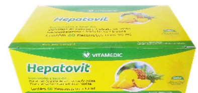
9802-Hepatovit (abacaxi) c/48x10ml Referência: Epocler