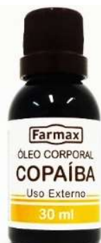
3072-Óleo de copaíba 30 ml 8494-Óleo Corporal copaíba 30ml