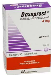
10869-Doxaprost 4mg c/30 Doxazosina Referência: Unoprost