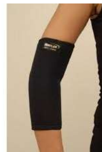
10278-Cotoveleira neoprene G D-660