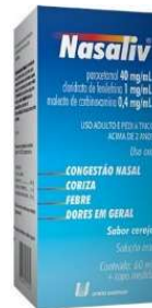
10659-Nasaliv solução 60ml