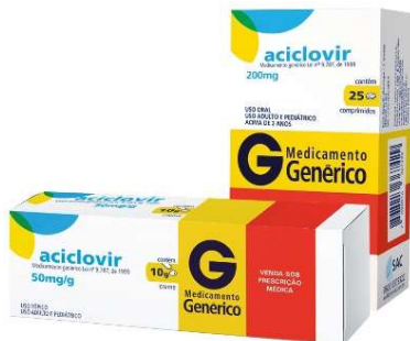
8636-Aciclovir 20mg c/25 8612-Aciclovir creme 10g Referência: Zovirax