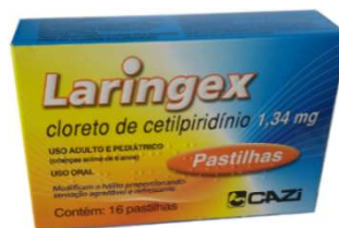
8465- Laringex 1,34mg c/16 Past Cetilpiridino