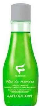
10366-Óleo de mamona (ricino) corpo e cabelo 130ml