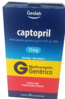
9988-Captopril 25mg c/30 9989-Captopril 50mg c/30 Referência: Capoten