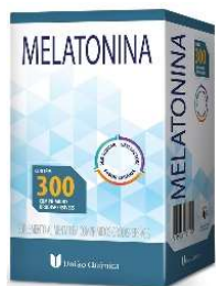
11176-Melatonina c/300 comp orodispersíveis Referência: Maracugina