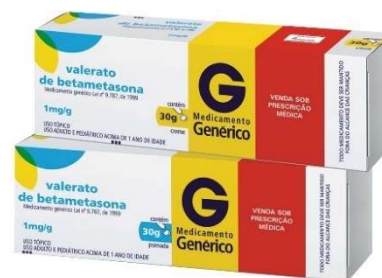
8712-Betametasona creme 30g 8713-Betametasona pda 30g Referência: Betnovat