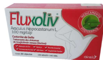
3998-Castanha da india (fluxoliv) 100mg c/30 Airela