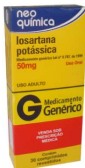
6488-Losartana pot 50mg c/30 Referência Cozaar