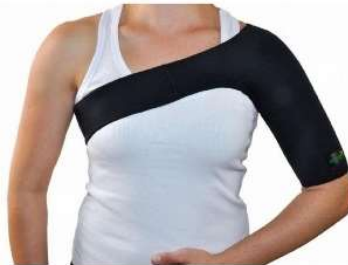
10405-Ortese para ombro G D-680