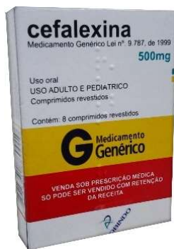
7473-Cefalexina 500mg c/8 Referência: Keflex