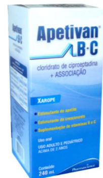
1163-Apetivan B+C 240ml Polivitaminas