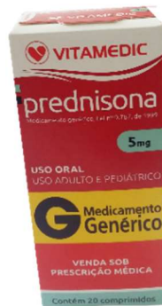
9072-Prednisona 5mg c/20 9071-Prednisona 20mg c/10 Referência: Meticorten