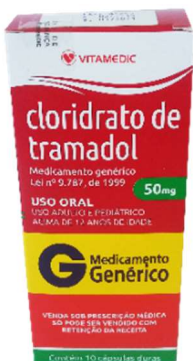
9640-Tramadol 50mg c/10 Referencia: Tramal