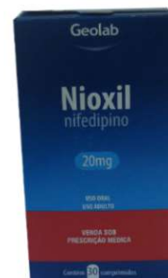
8354-Nioxil 20mg c/30 Nifedipino Referência: Adalat