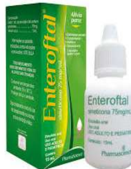
2196-Enterofital gts 15ml Simeticona Referência: Luftal