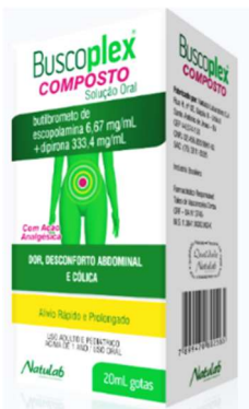
8399-Buscoplex gts 20 ml Escopolamina + Dipirona Referência: Buscopan Comps