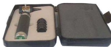
2604-Otoscópio TK 6256-Otoscópio mini Missouri