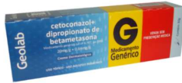
6760-Cetoconazol+ beta pom 30g 6420-Cetoconazol+beta creme 30g Referência: Canddicort