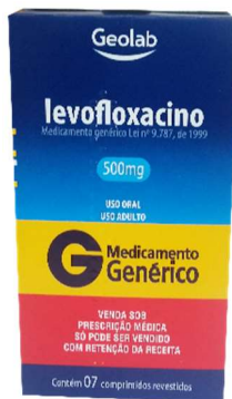
9080-Levofloxacin 500mg c/7 9079-Levofloxacin 500mg c/10 Referência: Tavanic