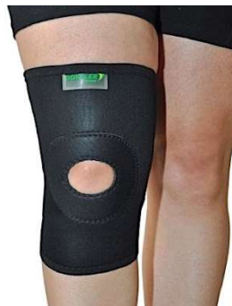
10269-Joelheira c/orifício e sup.patelar P D-644