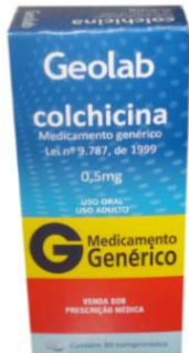
7982-Colchicina c/30 Referência: Colchis