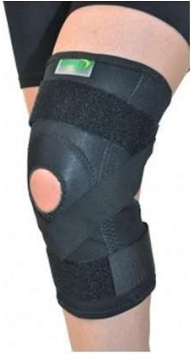
10274-Joelheira neoprene artic.c/cintas cruzadas M D-652