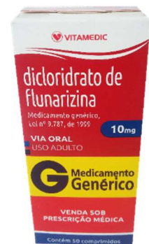
9644-Flunarizina 10mg c/50 Referência: Vertizine