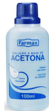
3217-Acetona Blue 100ml c/ 12 8693-Acetona Blue 200ml 7253-Acetona blue 500ml