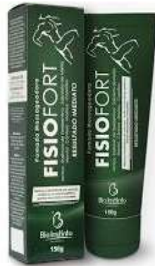
9710-Pomada massageadora 150g Bio Instinto