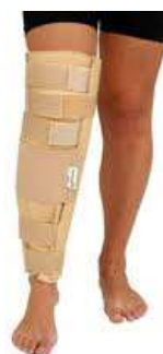
10262-Imobilizador de joelho fixo 50cm- largo D-521