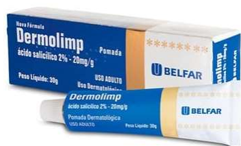
7384-Dermolimp pda 30g Ac. Salicílico Referência: Epydermy