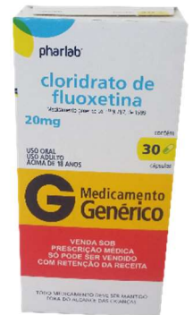
9732-Fluoxetina 20mg c/30 Referência: Prozac