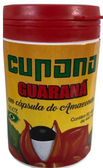
860-Guaraná em caps 60g