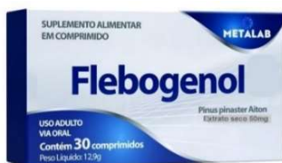
11023-Flebogenol comp c/30 Referência: Flebon