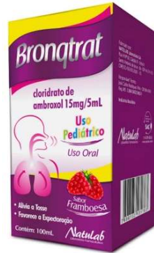
8649-Bronqtrat limão Ad 100ml 8650-Bronqtrat framboesa inf 100ml Cloridrato de Ambroxol Referência: Mucosolvan