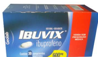
8257-Ibuvix 600mg c/30 Ibuprofeno Referência: Dalsy