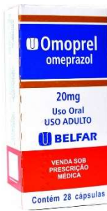
10562-Omoprel 40mg c/56 10945-Omoprel 20mg c/56 10946-Omoprel 40mg c/28 Omeprazol Referência: Losec