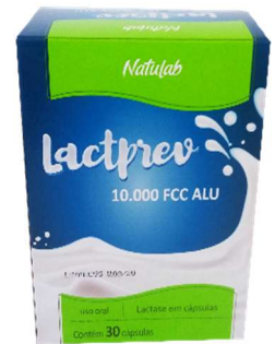
9724- Lactprev c/30 Lactase em caps Referência: Lactosil