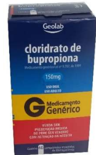
10052-Bupropiona 150mg c/60 Referência: Zyban