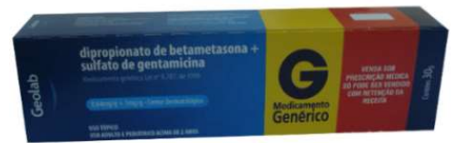
6421-Betametasona+Gentamicina creme 30g Referência: Diprogenta