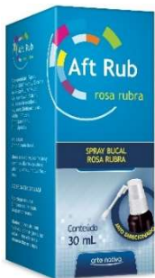
8326-Aft Rub spray 30ml Rosa Rubra