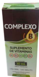
9270-Complexo B sol.100ml 9829-Complexo B cp c/100 9271-Complexo B cp c/50 8723-Complexo B sol. 30ml