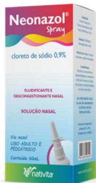
10630-Neonazol spray 60ml 9673-Neonazol ad 30ml Referência: Sorine