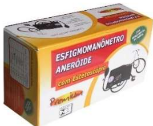
5125- Aparelho de pressão c/ braçadeira metal e estetoscópio 6209- Aparelho de pressão c/ braçadeira velcro e estetoscópio 6762- Aparelho pressão digital de pulso 9300- Aparelho pressão digital de pulso auto Premium