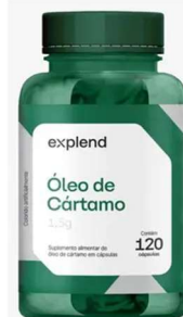
11144-Oleo de cartamo c/120 caps Explend