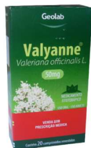
8210-Valyanne 50mg c/20 Valeriana officinalis