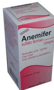
9010-Anemifer Drgs c/50 6475-Anemifer gts Sulfato Ferroso Referência: Sulfato Ferroso