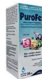
11028-Purofer bisglicinato ferroso 30mL Referência: Neutrofer