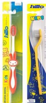
10992-Escova dental macia kids cabo emborrachado 2543-Escova dental macia kids cabo plástico