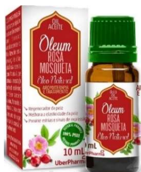
8850-Oleo rosa mosqueta natural 10ml