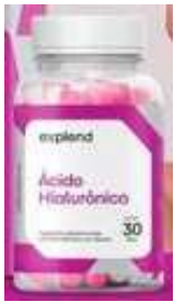
11001-Acido hialurônico 500mg c/30 caps Explend