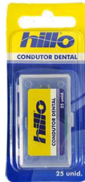
4972-Conductor dental c/25 un