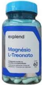
11049-Magnésio L-treonato c/60 caps Explend