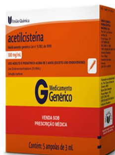
11240-Acetilcisteína 100mg inj c/5 ampolas 3ml iv/inal