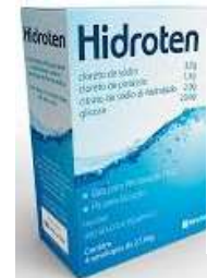
2912-Rehidratante hidroten oral pó natural 27,9g c/6 envelopes 11213-Rehidratante hidroten oral pó natural 27,9g c/4 envelopes