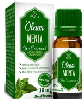
10468-Oleo essencial Menta Piperita 10 ml