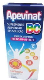
3859-Apevinat b+c 240ml Airela