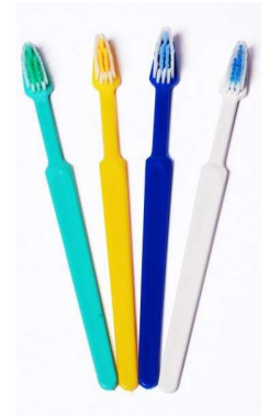
2542-Escova dental adulto macia 34 tufos