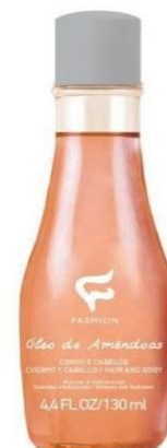
10365-Óleo de amendoas corpo e cabelo 130ml