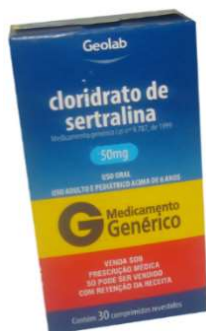
8996-Sertralina 100mg c/30 8707-Sertralina 50mg c/30 Referência: Tolrest