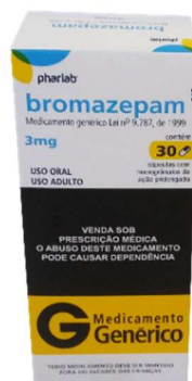
9728-Bromazepam 3mg c/30 9729-Bromazepam 6mg c/30 Referência: Lexotan