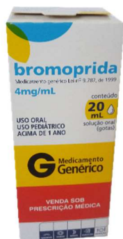
8974-Bromoprida gts 20ml Referência: Digesan