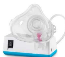
11082-Nebulizador inalador compressor neb air HC068