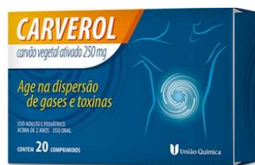
10658-Carverol 250mg c/20 Carvão Vegetal Ativado