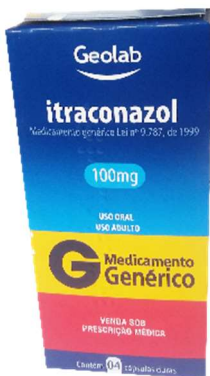
9437- Itraconazol 100mg c/4 Referência: Tracnoz