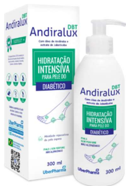
10947-Andiralux DBT hidratante pele diabético 300ml