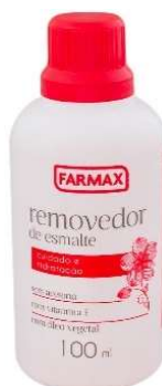
9507-Removedor vit. E 100ml 9508-Removedor s/perf.100ml 9509-Removedor uva 100ml