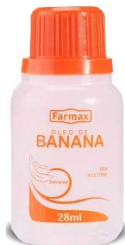
9505-Óleo banana 100ml 0089-Óleo banana 28ml