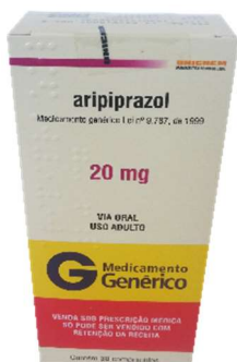
9702-Aripiprazol 10mg c/30 9703-Aripiprazol 15mg c/30 9978-Aripiprazol 20mg c/30 10129-Aripiprazol 30mg c/30 Referência: Abilify Kavium