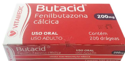
9525-Butacid 200mg c/ 20 5196-Butacid 200mg c/ 20x10 Fenilbutazona cálcica Referência: Bulasona cálcica