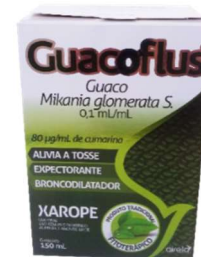
3114-Guaco xpe 150ml 11224-Guaco xpe 100ml Airela