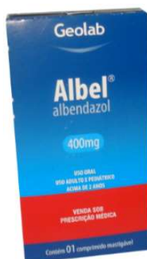
6414-Albel 10ml 6135-Albel 400mg c/1 8438-Albel 400mg c/3 Albendazol Referência: Zentel