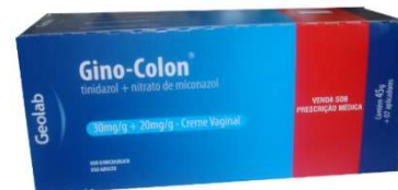
8178-Gino-Colon cr vg 45g c/ 07 aplicadores Tinidazol+Miconazol Referência: Gino-Pletil