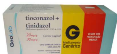
8255-Tioconazol+Tinidazol cr. Vg. 35g 7 aplicadores Referência: Cartrax