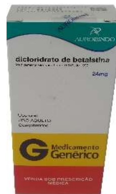
10195-Betaistina 24mg c/30 10234-Betaistina 16mg c/30 Referência-Betaserc