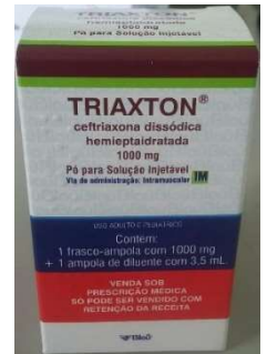
8977-Triaxton 1g pó inj em amp+diluyente 3,5ml Ceftriaxona dissodica