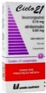
10450- Ciclo 21 c/21 Levonorg.+Ethinylestradiol