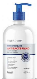
6938-Sabonete liq. 480ml antibacteriano 10039-Sabonete liq. 200ml antibacteriano 10041-Sabonete íntimo neutro 200ml