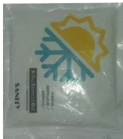
8722-Bolsa térmica gel anticongelante media 8721-Bolsa térmica gel anticongelante pequena