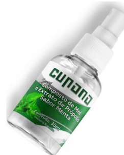
10755-Propolis spray mel e roma 30ml