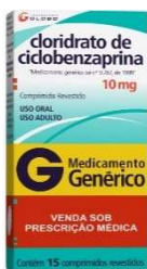
10136-Ciclobenzaprina 10mg c/30 10135- Ciclobenzaprina 5mg c/30 10624- Ciclobenzaprina 5mg c/15 Referência: Miosan