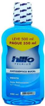
10990-Antisséptico bucal menta 500ml pague 350ml 10938-Antisséptico bucal menta pack 500ml+250ml