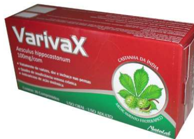
6264-Castanha da índia (Varivax)100mg c/30 8191-Castanha da índia (Varivax)300mg c/30 Referência: Castanha da índia