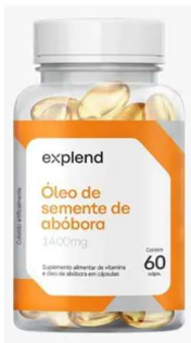
11002-Oleo de semente de abobora 1400mg c/60 caps Explend