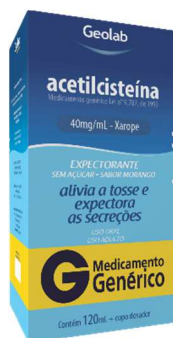
10009-Acetilcisteína 600mg 16x5g 6842-Acetilcisteína ad. s/açúcar morango 40mg 120ml 6843- Acetilcisteína inf. s/açúcar framboesa 20mg 120ml Referência: Fluimucil