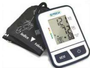
9172- Aparelho de pressão digital de braço