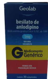
8529-Anlodipino 5mg c/30 4958-Anlodipino 10mg c/30 Referência: Norvasc