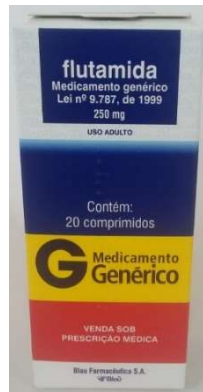
10513-utamida 250 mg c/20 Referência: Eulexin/Teflut