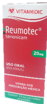
9528-Reumotec 20mg c/10 Tenoxicam Referência: Tilatil