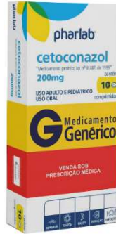
4346-Cetoconazol creme 30g 7701-Cetoconazol 200mg c/10 5429-Cetoconazol 200mg c/30 Referência: Nizoral