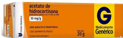
10683-Hidrocortisona creme 20g Referência: Berlison