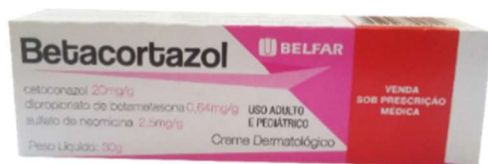
1513-Betacortazol cr 30g Cetoconazol+beta+neomicina Referência: Novacort