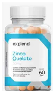
11006-Zinco quelato 500mg c/60 caps Explend