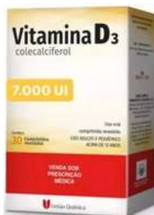
Vitamina D 11241- 7.000UI c/30 11242- 10.000UI c/4 11243- 10.000UI c/8 11244- 50.000UI c/4