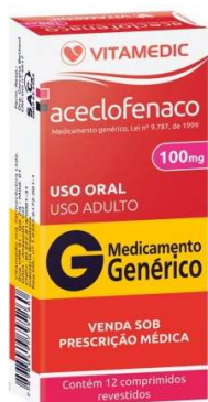
8445- Aceclofenaco 100mg c/12 Referência: Proflan