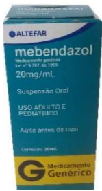
10220-Mebendazol susp 30ml 3886-Mebendazol 100ml c/6 Referência: Pantelmin