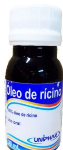
9006-Oleo de rícino 30ml Uniphar