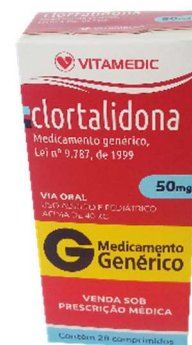
9679-Clortalidona 50mg/28 Referência: Higroton