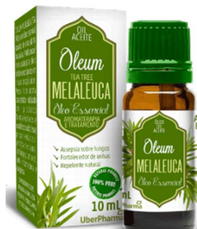
10353-Oleo essencial Melaleuca 10ml