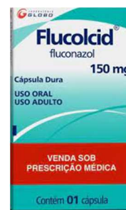
5946-Flucolcid 150mg c/1 5947- Flucolcid 150mg c/2 Referência: zoltec