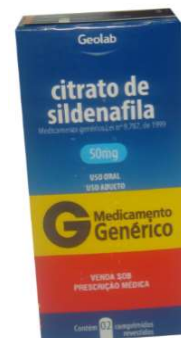
8697-Sildenafil 50mg c/2 Referência: Viagra