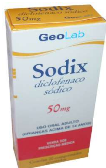
6841-Sodix 50mg c/20 Diclofenaco Sódico Referência: Voltaren