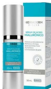
11174-Serum ácido hialurônico Hidraderm ciclos 30ml