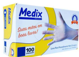
10396-Luva proced.vinil G s/po c/100 10395- Luva proced.vinil M s/po c/100 10394- Luva proced.vinil P s/po c/100