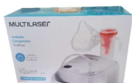
9625-Nebulizador inalador compressor neblus HC110 10362-Nebulizador inalador compressor nebasyl HC267