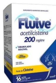
10223-Fluive 200mg c/16x5g env.eferv. 11222-Fluive ad 40mg 120ml Acetilcisteína Airela