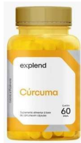
10962-Curcuma 500mg c/60 caps Explend