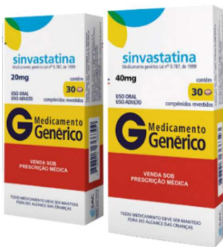
8518-Sinvastatina 10mg c/30 8566-Sinvastatina 20mg c/30 8610-Sinvastatina 40mg c/30 Referência: Zocor