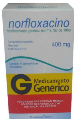
6568-Norfloxacino 400mg c/14 Referência: floxacin