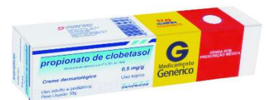
8950-Clobetasol creme 30g Referência: Psorex