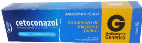
9990-Cetoconazol creme 30g Referência: Canddicort