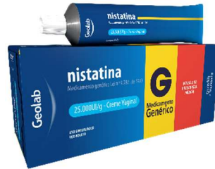
8886-Nistatina cr v c/14 apl. 60g Referência: Micostatin