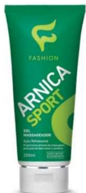
9086- Gel Arnica Sport 200ml 9087- Gel Arnica extra forte 200ml