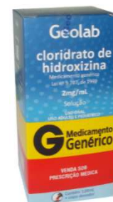
6422-Hidroxizina sol 120ml Referência: Hidroxizina