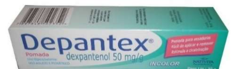
6559-Depantex pom. 30g Dexpanthenol Referência: Bepantol