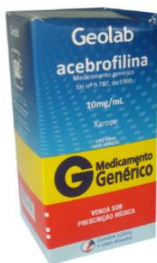
6944-Acebrofilina ad 6945-Acebrofilina inf Referência: Brondilat