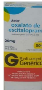
10607-Escitalopram 20mg c/30 Referência: Lexapro