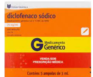
10733-Diclofenaco sódico 25mg inj c/ 5x3ml