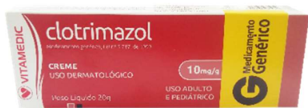
4477-Clotrimazol 20g Referência: Canesten