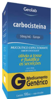
8960-Carbocisteína ad 100ml 8959-Carbocisteína Inf. 100ml Referência: Mucolitic