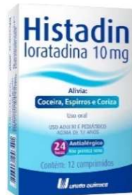
10967-Histadin 10mg c/12 Loratadina Referência: Claritin