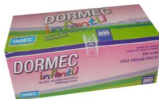
8004- Dormec inf 100mg c/200 9473- Dormec ad 500mg c/200 ácido acetilsalicílico Referencia: Aspirina