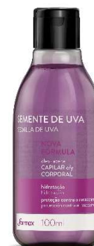
8544-Óleo capilar e corporal semente de uva