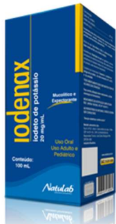
8788-Iodenax 100ml Iodeto de Potássio Referência: Cloreto Potássio