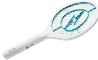
10887- Raquete etétrica mata insetos HC034 Multilaser