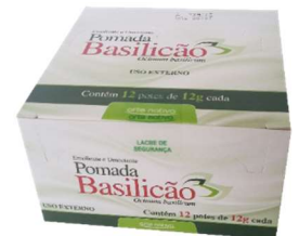
9830-Pomada basilicão 12g c/12