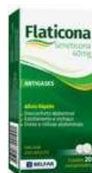
4828-Flaticona gts 20ml Simeticona Referência: Luftal