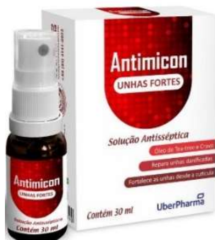
9954-Melaleuca antimicon solução spray 30ml