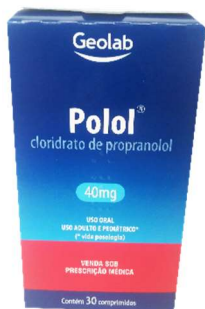
8252-Polol 40mg c/30 Clor.Propranolol Referência: Propranolol