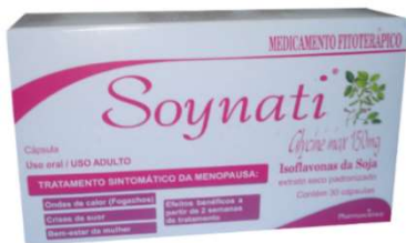
8248-Soynati caps 150mg c/30 Isoflavona