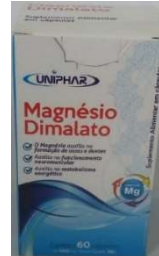
5341-Magnésio dimalato 500mg c/60 caps Uniphar