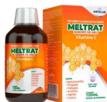
11025-Meltrat xpe 120mL Referência: Melagrião