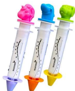
10826-Dispositivo nosewash tubarão 10ml 10827-Dispositivo nosewash cachorro 10ml 10839-Dispositivo nosewash unicórnio 10ml