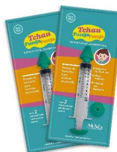
11149-Dispositivo p/lavagem nasal verde 10ml Munila