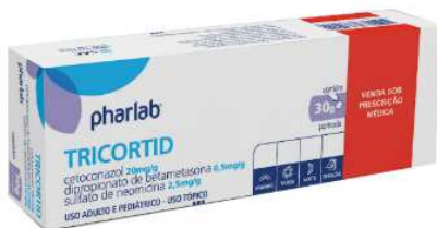
3586-Tricortid creme 30g 3434-Tricortid pda 30g Cetoconazol, Betametasona Neomicina Referência: Novacort