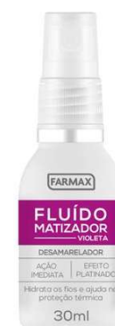
3225-Violeta Genciana 30 ml c/12