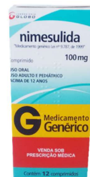
9733-Nimesulida 100mg c/12 Referência: Nisulid