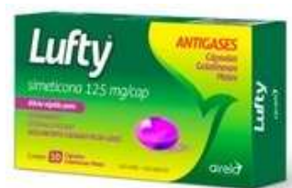
10148-Lufty 125mg c/10 caps mole gelatinosa Simeticona Referência: Luftal