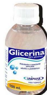
10115-Glicerina 100ml Uniphar