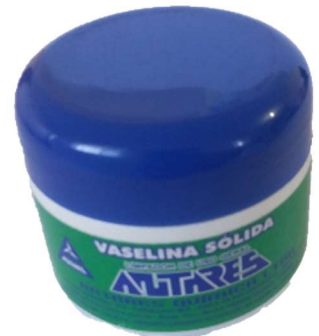
9262-Vaselina sólida 50g Antares