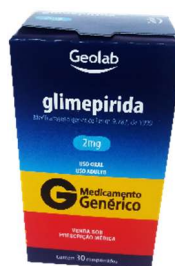
849-Glimepirida 2mg c/30 Referência: Amaryl