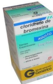
4891-Bromexina ad 120ml 4890-Bromexina inf 120ml Referência: Bisolvan