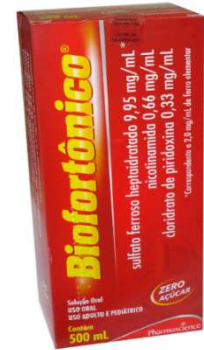
1074-Biofortônico 500ml Ferro + Associações Referência: Biotônico