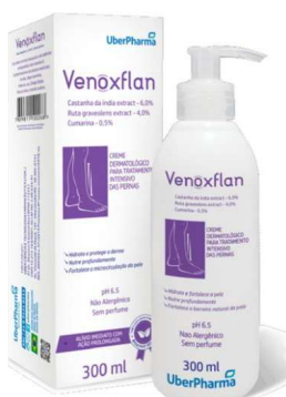
5552-Creme para p/ pernas Venoxflan 300ml