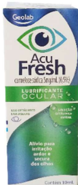
8868-Acu Fresh 5mg/ml 0,5% sol oft. 10ml Carmelose sódica Referência: Fresh Tears