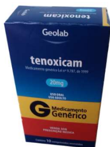
8435-Tenoxicam 20mg c/10 Referência: Tilatil