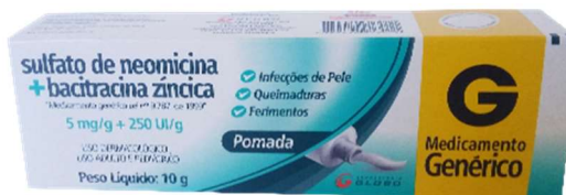
9701-Neomicina+Bacitracina 10g Referência: Nebacetin