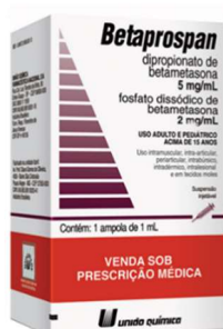
11247-Betaprospan inj c/ 1 ampola 1ml + seringa + agulha Betametasona Referência: Diprosan