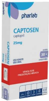
1596-Captosen 25mg c/30 Referência: Capoten