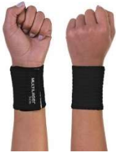
10889- Munhequeira c/velcro unissex Tam-U HC336 Multilaser