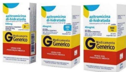
8582-Azitromicina 500mg c/3 9917-Azitromicina 500mg c/5 8583-Azitromicina 600mg 8584-Azitromicina 900mg Referência: Zitromax