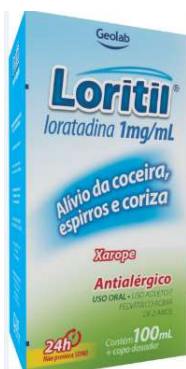
8077-Loritil 10mg c/12 8341-Loritil xpe 100ml Loratadina Referência: Claritin