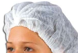
9858- Touca descartável c/100 Labor