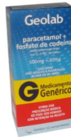
8010-Paracetamol+Codeína 500+30mg c/12 9553-Paracetamol+Codeína 500+30mg c/24 Referência: Tylex