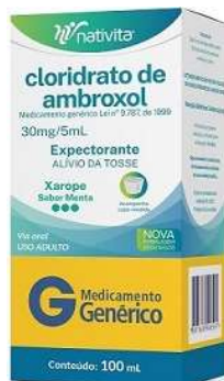
10049-Ambroxol ad menta 100ml 10492-Ambroxol inf framboesa 100ml 9258-Ambroxol gts 50ml Referência: Mucosolvanc