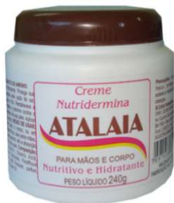
7546-Crema nutridermina p/ mãos e corpo 240g 7547-Crema nutridermina p/ mãos e corpo 50g