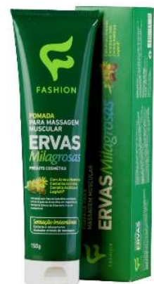
9083- Ervas Milagrosas 150ml