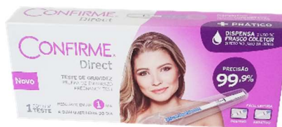
9693- Teste de gravidez em tiras