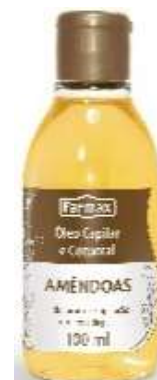
3091-Óleo de amêndoas capilar e corporal 100ml