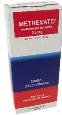
8977-Metrexato 2,5mg c/24 Metotrexato Referência: Miantrex