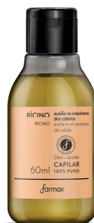
10209-Óleo de Rícino Puro capilar 30ml 9075-Óleo de Rícino capilar 100ml 11035-Óleo de Rícino Puro capilar 60ml