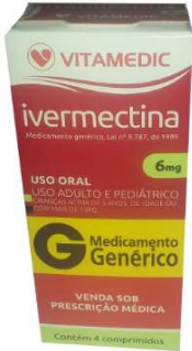
6213-Ivermectina 6mg c/2 6214-Ivermectina 6mg c/4 Referência: Revectina