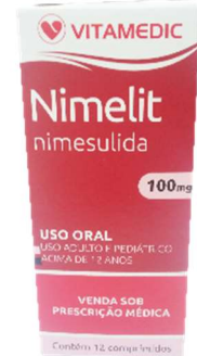
2146-Nimelit c/12 2147-Nimelit gts nimesulida Referência: Nisulid