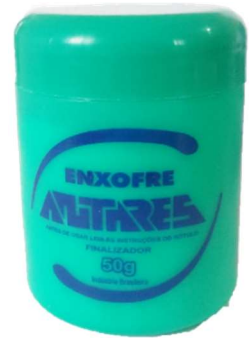
8987-Enxofre 50g Antares