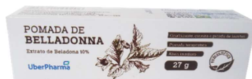
9801-Pomada Belladonna 27g