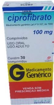
9264-Ciprofibrato 100mg c/30 Referência: Oroxadin