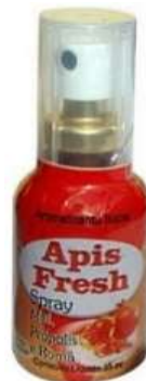
2971-Própolis Spray mel 35ml 2972-Própolis Spray mel e gengibre 35ml 2973-Própolis Spray mel e menta 35 ml 2974-Própolis Spray mel e roma 35 ml 7545-Própolis spray mel gengibre malva menta romã 35ml