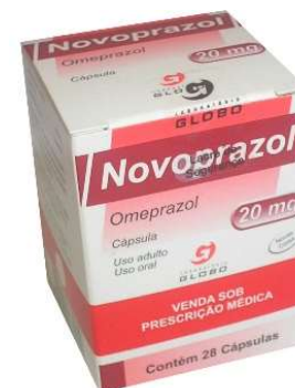
4644-Novoprazol 20mg c/28 4645-Novoprazol 20mg c/56 Omeprazol Referência: Losec