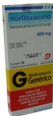
5699-Norfloxacino 400mg c/14 Referência: Floxacin