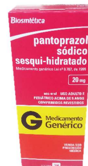
1082- Pantoprazol 20mg c/28 Referência: Zurcal