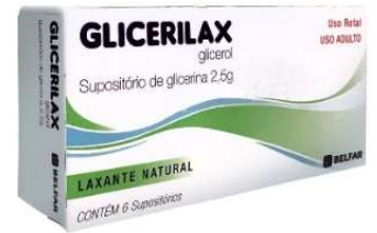
10549-Glicerilax pediátrico c/6 10550-Glicerilax adulto c/6