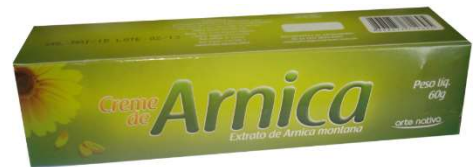
6413-Arnica creme 60 g