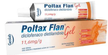
7885-Poltax Flan 60g Dicl. Dietilamônio Referência: Cataflan