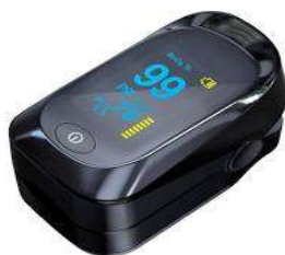
1233-Oxímetro de pulso ox-06 Multilaser