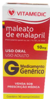
9377-Enalapril 10mg c/30 9378-Enalapril 20mg c/30 Referência: Renitec