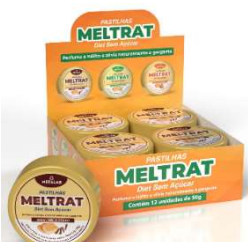
11041-Pastilha meltrat diet mel e canela 45g display c/12x60 11043-Pastilha meltrat diet mel e cravo 45g display c/12x60