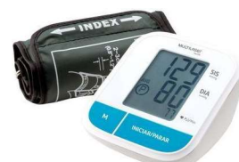
10260- Aparelho pressão digital de braço