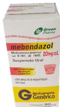
9292-Mebendazol 30ml Referência: Pantelmin