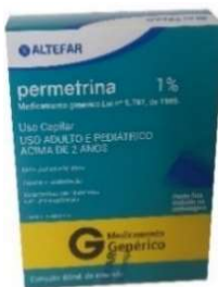
10221-Permetrina 1% loção 60ml Referência: kwell