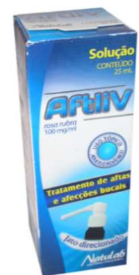
6734-Aftiv sol. 25ml Referência: Rosa rubra