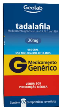
9164-Tadalafila 20mg c/1 9165-Tadalafila 20mg c/2 9163-Tadalafila 20mg c/4 9162-Tadalafila 5mg c/30 Referência: Cialis