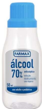
8547-Álcool 70% antisséptico 50ml