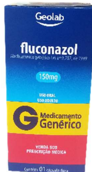
9219-Fluconazol 150mg c/2 Referência: Zoltec