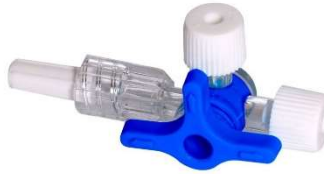
11100- Torneira 3 vias lock c/50 HC642 Multilaser