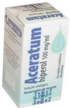
349-Aceratum 10ml Hiperol Referência: Cerumin