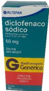
10229-Diclofenaco sódico 50mg c/20 10551-Diclofenaco sódico gel 60g Diclofenaco sódico Referência: Cataflan