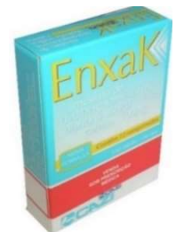
3714-Enxak 100mg c/12 Diidoergotamina+ Dipirona+ cafeína