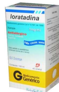
5104-Loratadina 100ml Referência: Claritin