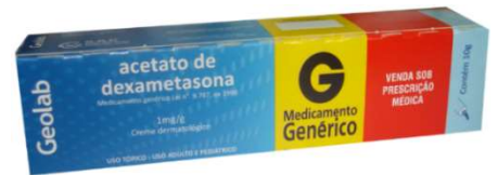
6155-Dexametasona creme 10g 8735-Dexametasona elixir 120ml Referência: Decadron