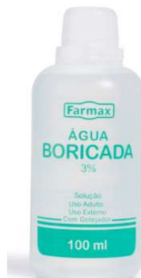
3084-Água Boricada 100ml c/ 12