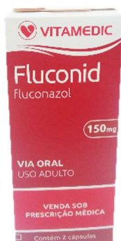
6212-Fluconid c/1 9526-Fluconid c/2 Fluconazol Referência: Zoltec