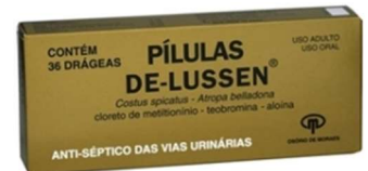
154- Pímulas de lussen c/36