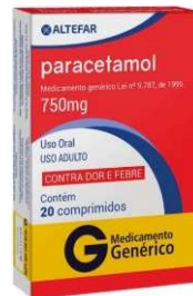
5270-Paracetamol 750mg c/20 10486-Paracetamol 750mg c/20x10 Referência: Tylenol