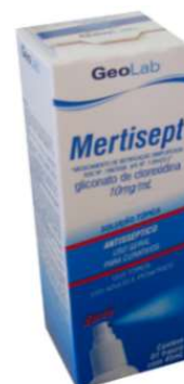
6150-Mertisept sol.30ml 6150-Mertisept spray.45ml Glic. clorexidina Referência: Merthiolate