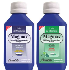
2725- Leite magnésia tradicional (Magmax) 100ml 4779- Leite magnésia Hortalã (Magmax) 100ml 11129- Leite magnésia tradicional (Magmax) 300ml 11145- Leite magnésia Hortalã (Magmax) 300ml