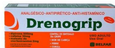
9687-Drenogrip comp c/20x6 10894-Drenogrip comp c/12