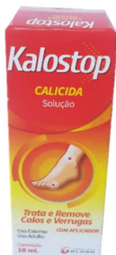
9738-Kalostop sol.10ml Calicida