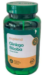
11003-Ginkgo biloba 500mg c/60 caps Explend