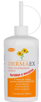
9712-Dermaex 100ml 9713-Dermaex 200ml