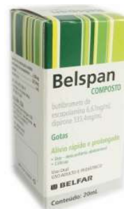
2920-Belspan gts 20 ml 2919-Belspan c/20 comp Escopolamina + Dipirona Referência: Buscopan Comps