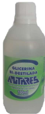
9260-Glicerina 100ml Antares