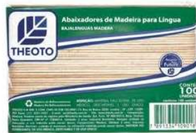
6808-Abaixador de língua c/100 Theoto