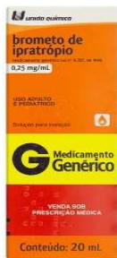
10967-Ipratrópio 0,25mg 20ml Brometo de Ipratrópio Referência: Atrovent