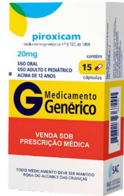
8588-Piroxicam 20mg c/15 Referência: Feldene