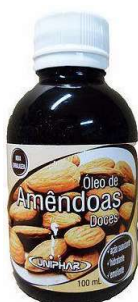
10465-Oleo de amêndoas doces 100ml Uniphar