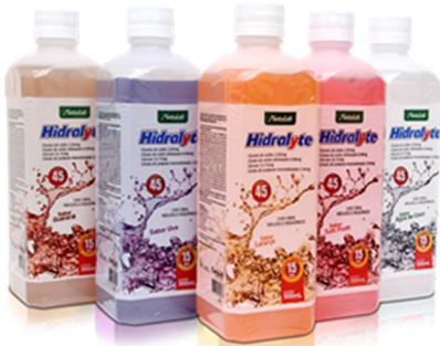
6829-Hidralyte água coco 500ml 6830-Hidralyte guaraná 500ml 6831-Hidralyte laranja 500ml 6832-Hidralyte tutti-frutti 500ml 6833-Hidralyte uva 500ml Referência: Pedialyte