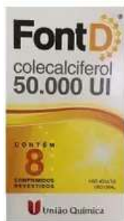
Vitamina Font D 10445- 50.000UI c/8 10446- 5.000UI c/30 10447- 7.000UI c/30 10448- 10.000UI c/8