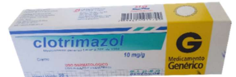
9266-Clotrimazol cr 20g Referência: Canesten