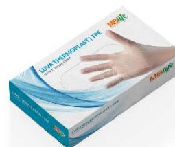
10397-Luva Thermoplast s/po uso geral P c/100