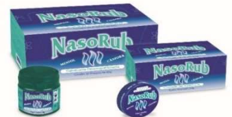
4071-Nasorub c/24x9 8815-Nasorub 40g Referência: Vick