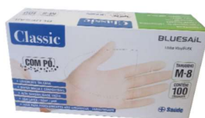
9727-Luva vinil P 9726-Luva vinil M 9725-Luva vinil G