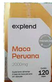
11078-Maca peruana premium 2000mg c/120 caps Explend