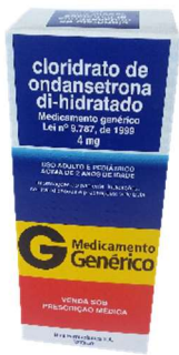
9630-Clor. Ondansetrona di-hidr. 4mg c/10 9631-Clor. Ondansetrona di-hidr. 8mg c/10 Referência: Vonal