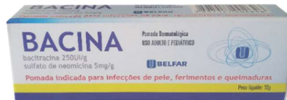
336-Bacina pom 10g Neomicina+Bacitracina Referência: Nebacetin