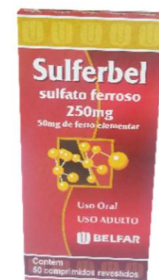
303-Sulferbel gts 30ml 304-Sulferbel drgs c/50 Sulfato ferroso Referência: Combiron