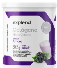
11163-Colageno hidrolisado sabor limão 250g 11164-Colageno hidrolisado sabor laranja e acerola 250g 11165-Colageno hidrolisado sabor frutas vermelhas 250g 11166-Colageno hidrolisado sabor amora 250g Explend