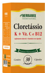
8369-Cloretássio 500mg c/30 8368-Cloretássio 200ml 10613-Cloretássio 500mg c/60 Referência: Cloreto Pot.Eni