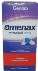
8554-Omenax 20mg c/28 caps 8527-Omenax 20mg c/56 cart. Omeprazol Referência: Losec