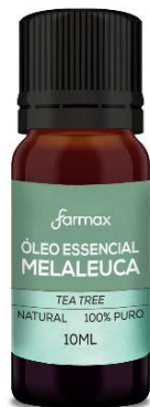
11207-Melaleuca óleo essencial 10ml