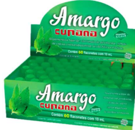
1094-Amargo Cupana flac.60x10ml