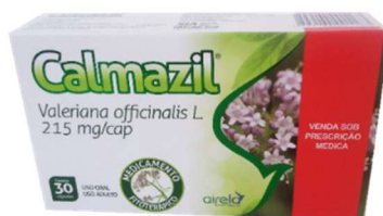
3999-Calmazil (valeriana officinalis) 215mg c/30 Airela