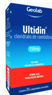
8433-Ultidin 150mg c/20 Cloridrato Ranitidina Referência: Antak