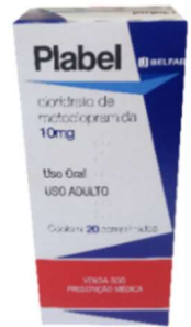
9545-Plabel c/20 10552-Plabel gts 10ml Metoclopramida Referência: Plasil