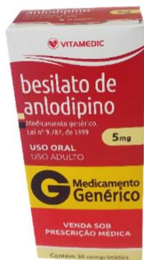
9645-Anlodipino 5mg c/30 9676-Anlodipino 10mg c/30 Referência: Norvasc