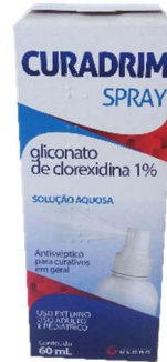
9685-Curadrim spray 60ml Glic. Clorexidina 1% Referência: Merthiolate