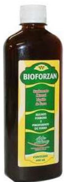
7003-Bioforzan 400ml 10179-Bioforzan 400ml sabor morango 10180-Bioforzan 400ml sabor uva Sulfato Ferroso+Pirof de Ferro Referência: Biotônico