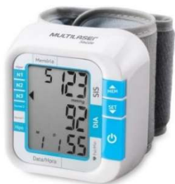
10261- Aparelho pressão digital de pulso Multilaser