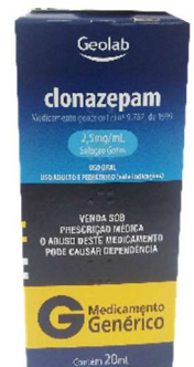
9246-Clonazepam 0,5mg c/30 6946-Clonazepam 2,5mg sol. 20ml. Referência: Rivotril