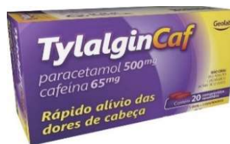
8349-Tylalgin c/20 8348-Tylalgin c/25x4 Paracetamol+Cafeina Referência: Tylenol DC