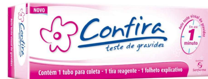
8755- Teste de gravidez em tiras c/ coletor