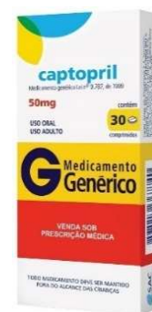
9292-Captopril 25mg c/30 8613-Captopril 50mg c/30 Referência: Capoten