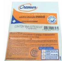
9049-Compressa de gaze esteril. c/10 13 fios 1197-Compressa de gaze esteril. c/10 11 fios 9382-Compressa de gaze esteril. c/10 9 fios 9383-Compressa de gaze esteril. C/5 11 fios 9286-Compressa de gaze esteril. c/5 13 fios