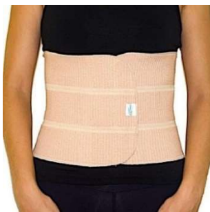
10266-Cinta elastica c/3 paineis G D-436