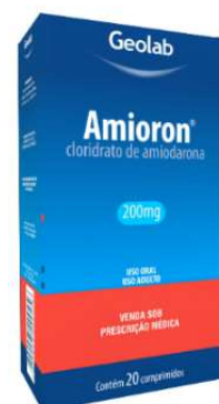
6611-Amioron 200mg c/20 8632-Amioron 200mg c/30 Amiodarona Referência: Atlansil