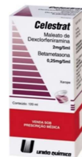
10685-Celestrat c/20 10738-Celestrat 120ml Dexclor+Betametasona Referência: Celestamine