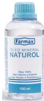
3394-Óleo Mineral puro 100ml