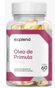
11143-Oleo de primula c/60 caps Explend