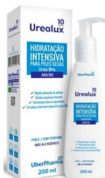
323-Ureia 10% Urealux hidratante 200 ml 5545-Ureia 3% Urealux hidratante 150 ml