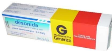
5220-Desonida creme 30g Referência: Desonol