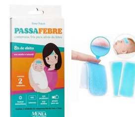
11148-Compressa fria passa febre c/12 Munila