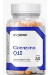
11068-Coenzima Q10 100mg c/30 caps Explend