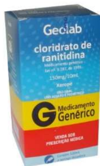
8433- Ranitidina 150mg c/20 7636- Ranitidina xpe 120ml+seringa Referência: Antak