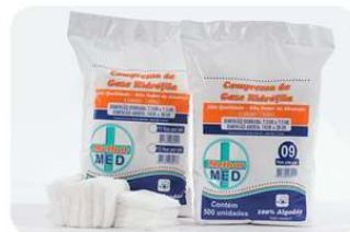
8594-Compressa de gaze 7,5x7,5 c/10 7216-Compressa de gaze 7,5x7,5 c/500 9854-Compressa de gaze ultra cotton 7,5x7,5 c/500 6910-Compressa de gaze estéril. c/60x10 Melhor med