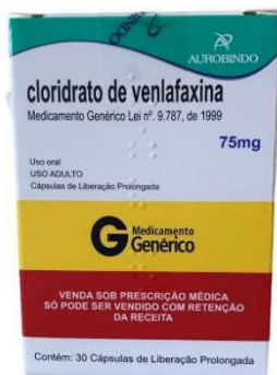
10376-Venlafaxina 75mg c/30 Referência-Venlaxin