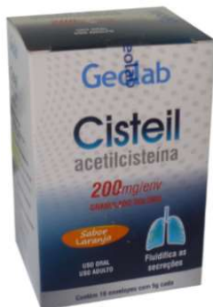
7696-Cisteil 200mg granulado c/16 env. 8311-Cisteil 600mg granulado c/16 env 8345-Cisteil ad.120ml 8346-Cisteil inf.120ml Acetilcisteína Referência: Fluimicil