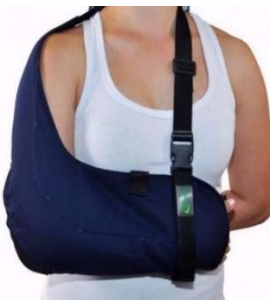
Tipoia simples bilateral azul D-229 10276-P 10275-M 10277-G