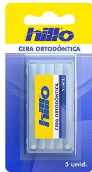
10939-Cera ortodôntica c/5 un