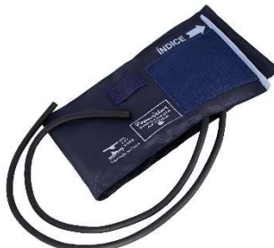
6761-Braçadeira metal p/ aparelho de pressão nylon Accumed 7063-Braçadeira velcro p/ aparelho de pressão nylon Premium