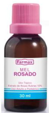
3431-Mel Rosado 30ml