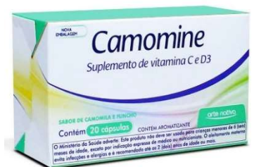
8275-Camomine c/20 caps