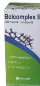
273-Complexo B (Belcomplex) c/50 Referência: Polivitaminico