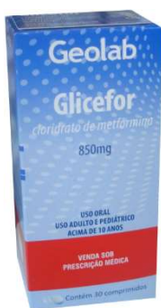
6131-Glicefor 850mg c/ 30 Metformina Referência: Glifage