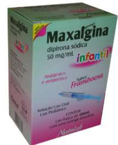
6270-Dipirona (Maxalgina) 100ml framboesa+seringa 5114-Dipirona (Maxalgina) 100ml framboesa c/copo 8021-Dipirona (Maxalgina) 10ml 8860-Dipirona (Maxalgina) 500mg c/30 9705-Dipirona (Maxalgina) 500mg c/10x10 10452-Dipirona (Maxalgina) 1g c/10 Referência: Novalgina