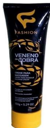
9369- Creme Veneno cobra 150ml