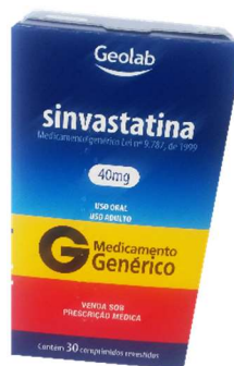
9849-Sinvastatina 20mg c/30 9822-Sinvastatina 40mg c/30 Referência: Zocor