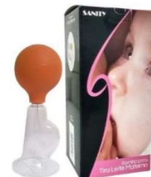
3068-Tira leite tradicional