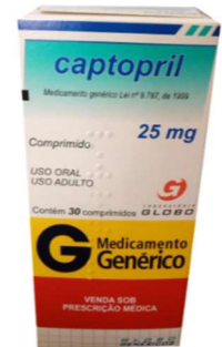
8440-Captopril 20mg c/30 Referência: Capoten