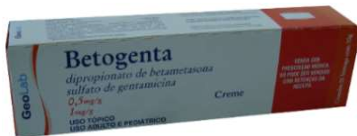
6939-Betogenta creme 30g 6940-Betogenta pomada 30g Betametasona+ gentamicina. Referência: Diprogenta