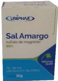
10186-Sal amargo 30g Uniphar