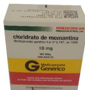
10153-Memantina 10mg c/30 10329-Memantina 10mg c/60 Referência: Ebix