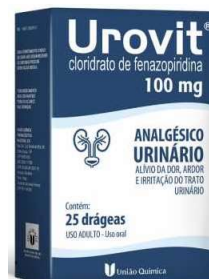
10475-Urovit 200mg c/18 Cloridrato de fenazopiridina Referência: Pvoidium