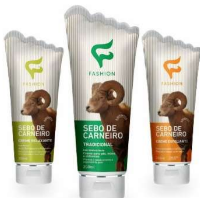
9081- Sebo de Carneiro esfoliante 200ml 9082- Sebo de Carneiro relaxante 200ml 8550- Sebo de Carneiro Tradicional 200ml 10306- Sebo de Carneiro Ureia 10% 200ml 10368- Sebo de Carneiro Tradicional 60ml