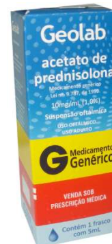
7721- Prednisolona sol oft 5ml Referência: Allergan