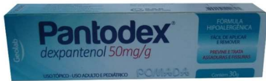
6149-Pantodex pda. 30g Dexpanterol Referência: Bepantol