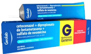
6418-Cetoconazol+beta+neom creme c/30g 6419-Cetoconazol+beta+neom pomada c/30g Referência: Novacort