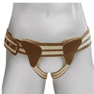
10289-Funda para hérnia inguinal dupla-U D-624