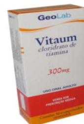
7720-Vitium 300mg c/30 Tiamina Referência: Benerva