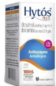
10480-Hytós plus 100ml Clobutinol+Doxilamina