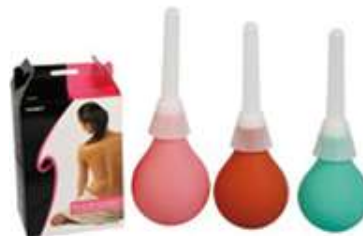
3070- Ducha gienologica 12 rosa 6580- Ducha gienologica 12 trad. 6581- Ducha gienologica 14 trad. 6121-- Ducha gienologica 10 trad.