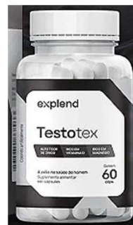
10963-Testotex 500mg c/60 caps Explend