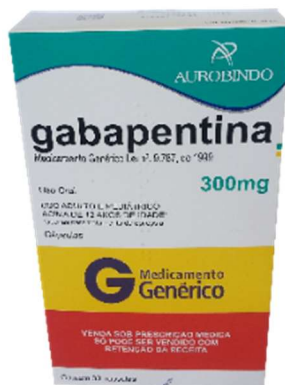
8871-Gabapentina 300mg c/30 Referência: Neurontin Aurobindo