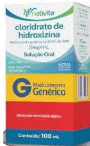
9522- Hidroxizina 100ml Referência: Prurizin