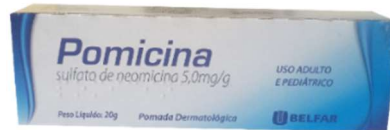
295-Pomicina pda 20g Neomicina Referência: Neomicina