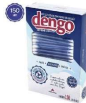
10034-Hastes Flexíveis dengo c/150 10035-Hastes Flexíveis dengo c/75 Melhor med