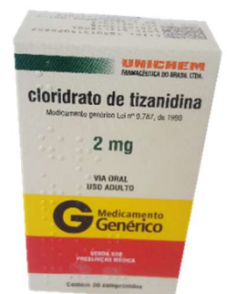
9806-Tizanidina 2mg c/30 Referência: Sirdalud