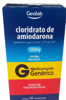
9652-Amiodarona 100mg c/30 9692-Amiodarona 200mg c/30 Referência: Atlansil