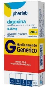
4684-Digoxina 0,25mg c/20 2057-Digoxina 0,25mg c/30 Referência: Digoxina