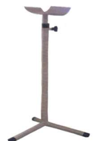
1238-Suporte p/ inj. veia e pressão Helma