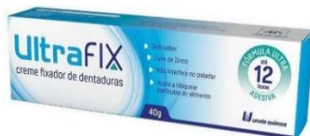
11110-Ultrafix fixador de dentaduras creme s/ sabor Referência: Corega