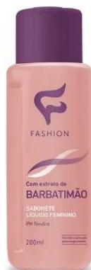
9371- Sabonete fem. 200ml