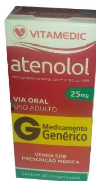
7517-Atenolol 25mg c/30 9192-Atenolol 50mg c/30 Referência: Atenol