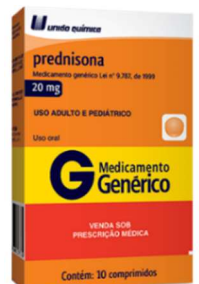
11013-Prednisona 20mg c/10 Referência: Meticorten