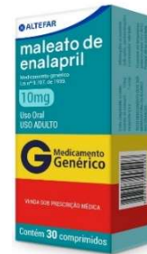
10485-Enalapril 10mg /30 10553-Enalapril 20mg /30 10484-Enalapril 5mg /30 Referência: Renitec