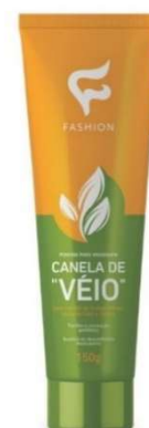
10299- Pomada massageadora canela de véio 150g