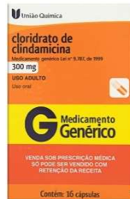
10828-Clindamicina 300mg c/16 Referência: Dalacin