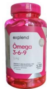
11143-Omega 3,6,9 mulher c/120 caps Explend