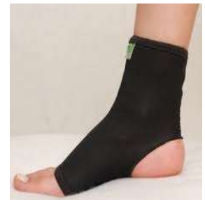
10273-Tornozeleira curta M D-625