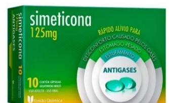
10868-Simeticona 125mg c/10 caps mole gelatinosa Referência: Lufal