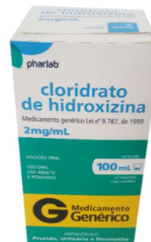
9993-Hidroxizina sol 100ml Referência: Hidroxizina