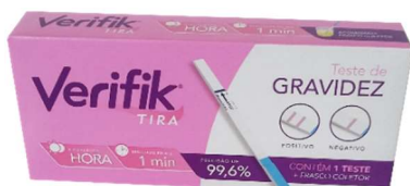
8651- Teste de gravidez em tiras