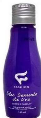
10036-Óleo de semente de uva corpo e cabelo 130ml