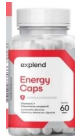
11071-Energy c/60 caps Explend