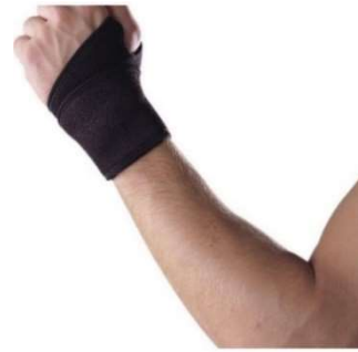
8803-Munhequeira Boomerang-U D-611 preta