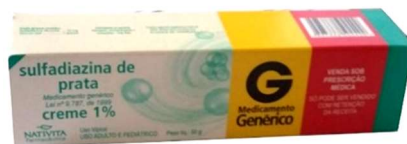
8501-Sulfadiazina Prata creme 30g 8502-Sulfadiazina Prata creme 50g