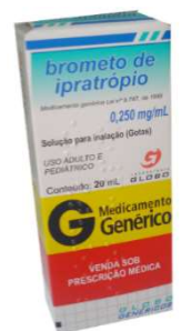
5281-Ipratrópio 20ml Referência: Atrovent