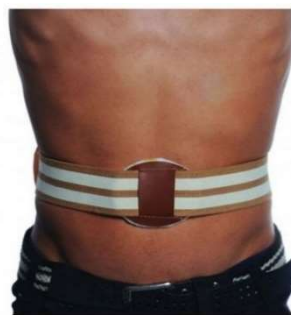
10264-Funda para hérnia umbilical-U D-628