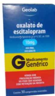
8212-Escitalopram 10mg c/30 9274-Escitalopram 20mg 15 ml Referência: Lexopro