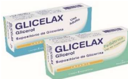
3535-Glycelax inf c/ 6 3534-Glycelax ad c/6 Glicerol Referência: Glycerin