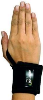
10407-Munhequeira regulável-U D-612