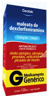
8377-Dexclorfeniramina xpe 120ml Referência: Polaramine