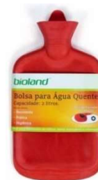
10373-Bolsa p/ água quente 2 litros