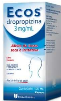
10479-Ecos xpe 120ml Dropropizina Referência: Vibrazin