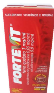
3866-FORTEVIT 500ML Airela