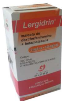
8730-Lergidrin 120ml Dexclorfeniramina+ Betametasona Referência: Celestamine