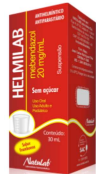
8081-Helmilab 30ml Mebendazol Referência: Pantelmin