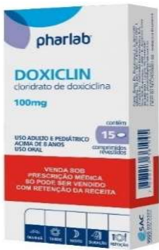
3339-Doxiclin 100mg c/15 Doxicilina Referência: Vibramicina