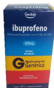
10050-Ibuprofeno 600mg c/20 Referência: Dalsy