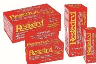
1279-Resfedryl c/20 3296-Resfedryl c/200 1514-Resfedryl gts 20ml 4026-Resfedryl mel e limão c/100 env. 5g 4526-Resfedryl mel limão c/ 50 env.5g 1472- Resfedryl xpe 100ml Paracetamol Clorfeniramina Fenileferina Referência: Fluviral