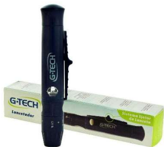
6477-Lancetador tipo caneta 8249-Lancetador mini tipo caneta G.Tech