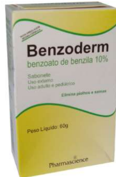
1276-Benzoderm sab. 1277-Benzoderm 100m Benzoato de Benzila Referência: Meticoçam