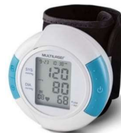
9971- Aparelho pressão digital de pulso Multilaser