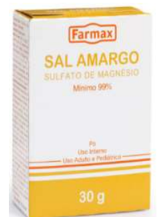
0003-Sal Amargo c/12