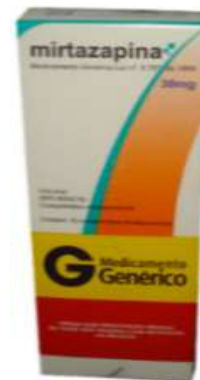
8593-Mirtazapina 30mg c/10 9763-Mirtazapina 30mg c/30 8715-Mirtazapina 45mg c/10 9966-Mirtazapina 45mg c/30 Referência: Remeron Aurobindo