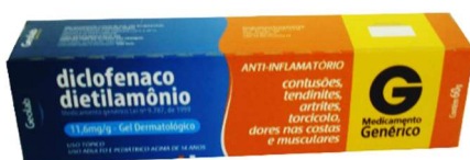
8375-Diclof. Dietilamônio 60g Referência: Cataflan Emulgel