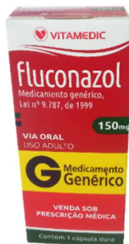
9646-Fluconazol 150mg c/1 9757-Fluconazol 150mg c/2 Referência: Zoltec