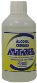
5201-Álcool Absoluto 50ml 5203-Álcool 70° INPM 50ml 9148-Álcool 70° INPM 1L 9689-Álcool isopropílico 1L 9149-Álcool isopropílico 100ml 9416-Álcool gel 450g 9415-Álcool gel 90g Antares