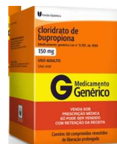
11245-Bupropiona 150mg c/60 Clor. Bupropiona Referência: Zyban