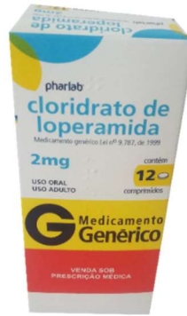
9994-Loperamida 2mg c/12 Referência: Imosec