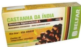
4361-Castanha da Índia c/60