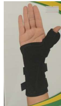
TALA P/PUNHO E POLEGAR D-325 DIREITO 10285- P 10286- M 10287- G ESQUERDO 10282- P 10283- M 10284- G