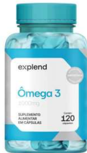
11047-Omega 3 1000mg c/120 caps Explend