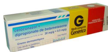
6987-Cetoconazol+Betametasona Creme 30g Referência: Candicort