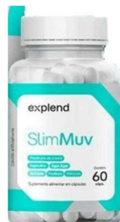
11070-Slim mov c/60 caps Explend