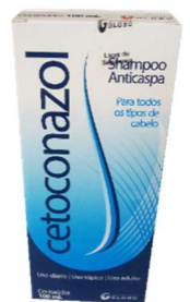
9745-Cetoconazol xpu 100ml