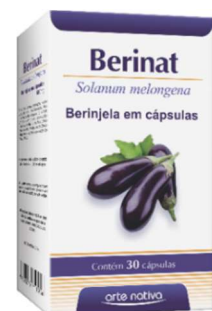
3298-Berinat c/30 Berinjela caps