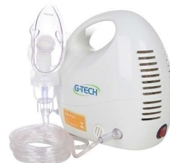
8725-Nebulizador e Inalador