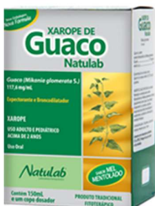
9942-Guaco e mel mentolado xpe 100ml 6371-Guaco e mel mentolado xpe 150ml