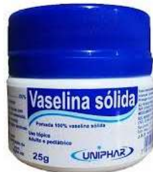
10117-Vaselina sólida 25g 10116-Vaselina líquida 100ml 10520-Vaselina sólida bisnaga 20g Uniphar