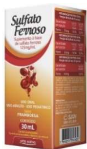
9555-Sulfato Ferroso gts 30ml