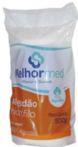
7995-Algodão hidrófilo 500g rolo 7997-Algodão hidrófilo bolas 100g 7998-Algodão hidrófilo bolas 50g Melhor Med