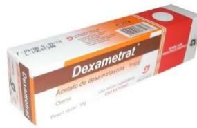
828-Dexametrat creme 10g Dexametazona Referência: Decadron