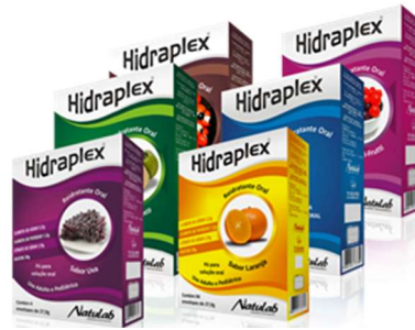
5914-Hidraplex agua de coco c/4 env 27,9g 5913-Hidraplex guaraná c/4 env 27,9g 5923-Hidraplex laranja c/4 env 27,9g 5916-Hidraplex tutti frut c/4 env 27,9g 5912-Hidraplex natural c/4 env 27,9g 5917-Hidraplex uva c/4 env 27,9g Referência: Pedialyte