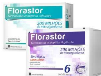
10476-Florastor c/12 caps 10477-Florastor sachê 4g c/6 Referência: Floratil