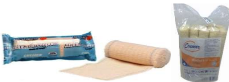
3124-Atadura crepom cysne de 6cm c/6 3125-Atadura crepom cysne de 8cm c/6 3126-Atadura crepom cysne de 10cm c/6 3127-Atadura crepom cysne de 12cm c/6 3128-Atadura crepom cysne de 15cm c/6 3129-Atadura crepom cysne de 20cm c/6 3131-Atadura crepom cysne de 30cm c/6 135-Atadura crepom cysne de 30cm x 1,80m 13 Fios c/12