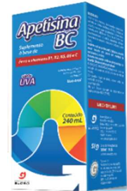
8085-Apetisina BC 240ml f.vermelhas 8086-Apetisina BC 240ml uva