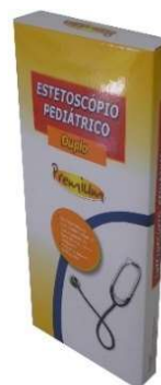
5678-Estetoscópio Duplo Ad Premium