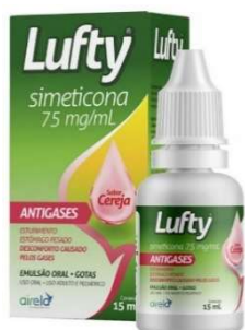
11230-Lufty 75mg gts 30ml 11231-Lufty 75mg gts 15ml Simeticona Referência: Luftal