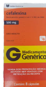
10831-Cefalexina 500mg c/10 1338-Cefalexina 500mg c/8 Referência: Keflex