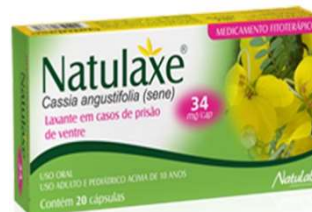
6263- Natulaxe (sene) 34mg c/20 caps Cassia Angustifolia