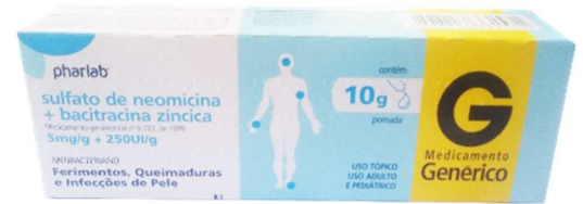
9920-Sulf. Neomicina+Bacitracina 10g Referência: Nebacetin