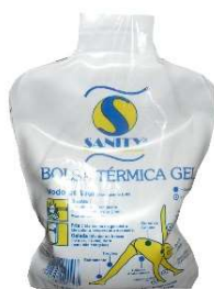
5232-Bolsa térmica gel Trad.300ml 5233-Bolsa térmica gel Trad. 600ml 5234-Bolsa térmica gel Trad.1000ml 7064-Bolsa térmica gel Lilas 300ml