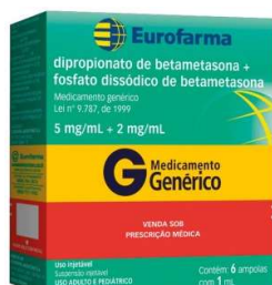
10546-Dipropionato beta+fosf.dis.beta inj c/6 amp