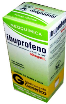
5717-Ibuprofeno 50mg 30ml tuti-fruti 5726-Ibuprofeno 100mg 20ml morango Referência: Alivium