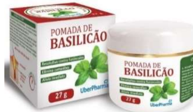
9720-Basilicão pomada 27g