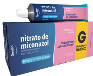
7787- Miconazol Cr vg 80g+14ap Referência: Daktarin