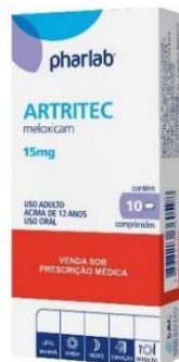
2207-Artritec 15mg c/10 2206-Artritec 7,5mg c/10 Meloxicam Referência: Movatec