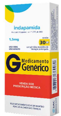
8587-Indapamida 1,5mg c/30 Referência: Natrilix