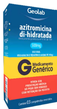
5894-Azitromicina 500mg c/03 Referência: Zitromax