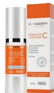
11175-Serum vitamina C Hidraderm ciclos 30ml