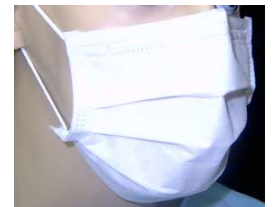
7952-Máscara desc. Elástico c/50 Embramac