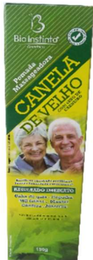
9709-Canela de velho pda massageadora 150g