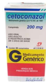
8778-Cetoconazol 200mg c/10 8780-Cetoconazol 200mg c/30 Referência: Nizoral