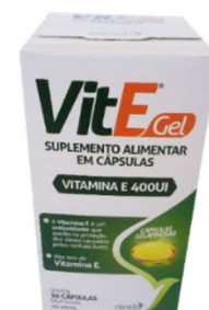
1594-Vitamina E 400ui c/30 Airela