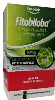
9670-Ginkgo biloba 80mg c/30 9911-Ginkgo biloba 120mg c/30