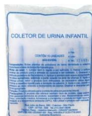
8796-Coletor urina infantil fem.c/10