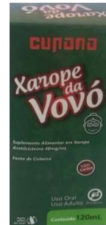
10942-Xarope da Vovó 120ml