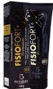
9711-Pomada massageadora premium 150g Bio Instinto