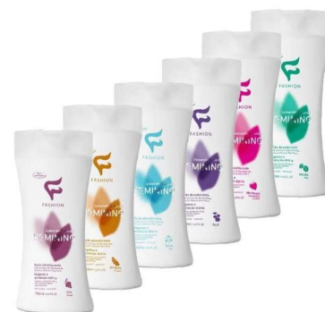
10300- Sabonete ínitimo fem. Acaí 180ml 10301- Sabonete ínitimo fem. aroeira 180ml 10302- Sabonete ínitimo fem. menta 180ml 10303- Sabonete ínitimo fem. morango 180ml 10304- Sabonete ínitimo fem. uva 180ml 10367- Sabonete ínitimo fem. talco 180ml