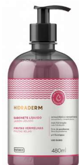
1949-Sabonete liq. C.Limão 480ml 1948-Sabonete liq. Erva Doce 480ml 1945-Sabonete liq. Frutas Ver. 480ml 1947-Sabonete liq. Neutro 480ml