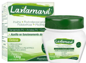
10954-Laxtamaril geleia pote 130g