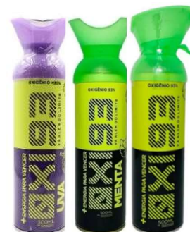
11209-Oxi93 oxigenio suplementar menta 500ml 11210-Oxi93 oxigenio suplementar uva 500ml 11211-Oxi93 oxigenio suplementar natural 500ml Biocare