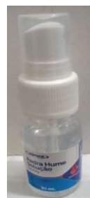
10466-Pedra hume spray c/ glicerina 30ml 10519-Pedra hume 30g Uniphar