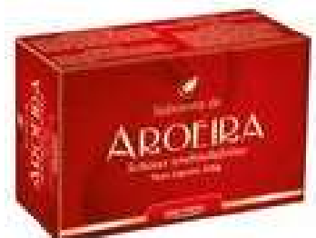
2514-Sabonete de aroeira 100g