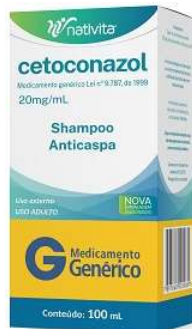
6901-Cetoconazol xpu Referência: Nizoral