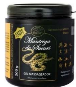
9800-Manteiga de Sucuri 200g 10734-Manteiga de Sucuri 130g