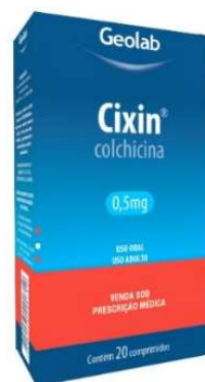
6134-Cixin comp. c/20 Calchicina Referência: Colchis