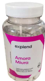
11005-Amora miura 500mg c/60 caps Explend