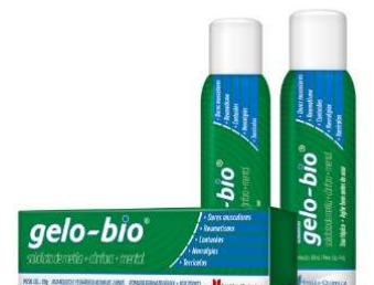
10679-Gelo-Bio aerosol 150ml 10681-Gelo-Bio aerosol 60ml 10680-Gelo-Bio pomada 20g Referência: Gelol