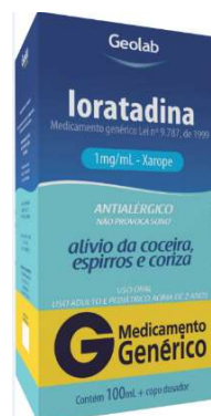
8301-Loratadina 100ml Referência: Claritin