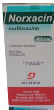
1105-Norxacin 400mg c/14 Norfloxacino Referência: Floxacin