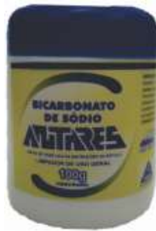
9259-Bicarbonato 100g Antares