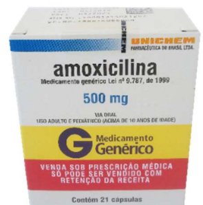
7480-Amoxicilina 500 c/21 Referência: Amoxil