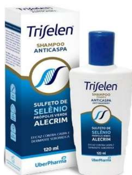
4481-Shampoo anticaspas Triselen 120ml Sulfato de selenio