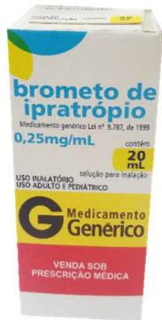
8915-Ipratrópio 20ml Referência: Atrovent