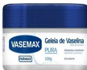
9632-Vaselina geleia pote 100g 9633-Vaselina geleia 60g