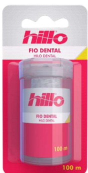
10937-Fio dental woman 100m 10994-Fio dental woman 100m leve 125m pague 100m