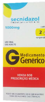
9442-Secnidazol 100mg c/2 10119-Secnidazol 100mg c/4 Referência: Secnidal