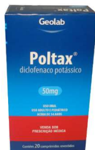
8252-Poltax 50mg c/20 Dicl. potássico Referência: Cataflan