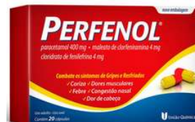
10451- Perfenol c/20 caps Fenilafrina+Clorfeniramina