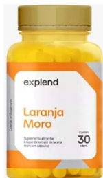
10958-Laranja moro 500mg c/90 caps Explend