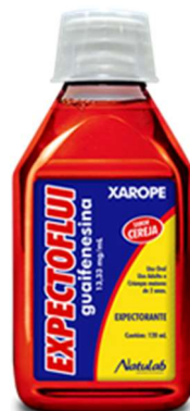
6266-Guaifenesina (Expectoflui) cereja 120ml Referência: Xpe Vick