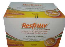
8285-Resfriliv mel limão c/10 env.5g 8253-Resfriliv mel limão c/50 env.5g chá 9273-Resfriliv laranja/acerola c/50 env.5g 10140-Resfriliv hortelã/gengibre c/50 env.5g Paracetamol Clorfeniramina Fenileferina Referência: Vick Pyrena