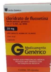
10161- Fluoxetina 20mg c/30 Cloridrato de fluoxetina Referência: Prozac