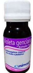
10114-Violeta Genciana 30ml Uniphar