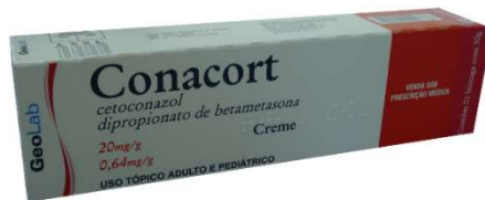
6969-Conacort Cr.30g 7967-Conacort pda.30g Cetoconazol+betametasona Referência: Candicort