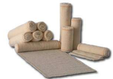
8023-Atadura crepom de 6cm c/12 8000-Atadura crepom de 10cm c/12 8001-Atadura crepom de 12cm c/12 8002-Atadura crepom de 15cm c/12 8003-Atadura crepom de 20cm c/12 8662-Atadura crepom de 25cm c/12