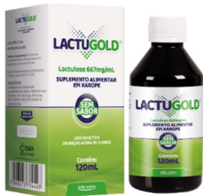
5640- Lactugold 120ml sabor ameixa 5641-Lactugold 120ml sabor frutas vermelhas 10214- Lactugold 120ml sem sabor