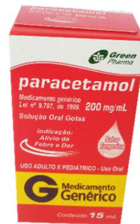
0914-Paracetamol gts 15ml Referência: Tylenol