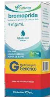
3518-Bromoprida gts 20ml Referência: Digesan