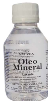
8576-Óleo mineral 100 ml