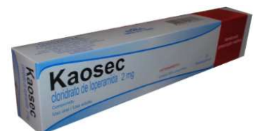
8039-Kaosec 2mg c/12 3982-Kaosec 2mg c/200 Loperamida Referência: Imosec