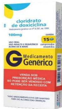
8585-Doxiciclina 100mg c/15 Referência: Vibramicina