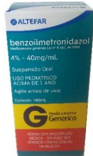
346-Benzoilmetronidazol 100ml Metronidazol Referência: Flagyl