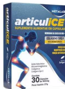
11029-Articulice 900mg c/30 caps softgel Referência: Fortice