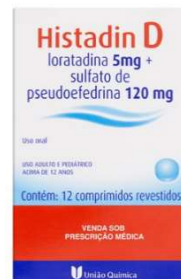
10792-Histadin c/12 Loratadina + Pseudoefedrina Referência: Claritin D