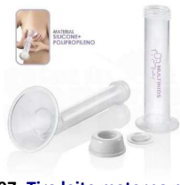
10997- Tira leite materno manual BB187 Multikdis