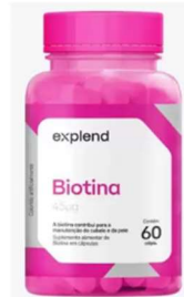
11007-Biotina 500mg c/60 caps Explend