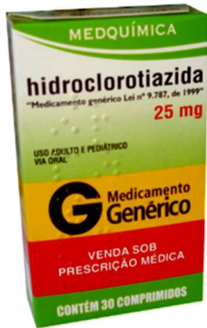
7915-Hidroclorotiazida 25mg c/30 Referência: Clorana