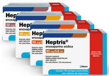
11215-Heptris 40mg c/10 inj. Enoxaparina sódica Referência: Clexane