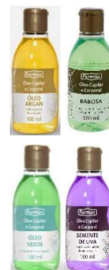
8546-Óleo Capilar e Corporal Argan 100ml 8543-Óleo Capilar e Corporal Babosa 100ml 9482-Óleo Capilar e Corporal cenoura 100ml 8936-Óleo Capilar e Corporal coco 100ml 11173-Óleo Corporal ameixa 1000ml 8545-Óleo Capilar e Corporal Verde 100ml 10327-Óleo de A mendoas Capilar e Corporal spray 100ml