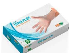
10399- Luva viniflex s/po G c/100 10398-Luva viniflex s/po M c/100