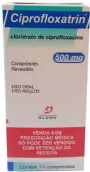
4641-Ciprofloxxtrin 500mg c/14 Clor. Ciprofoxacino Referência: Cipro