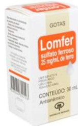
1377-Lomfer gts 30ml 1438-Lomfer xpe 100ml 1439-Lomfer drgs c/50 Sulfato ferroso Referência: Combiron