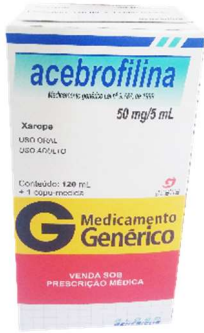
9386-Acebrofilina ad 9387-Acebrofilina inf Referência: Brondilat