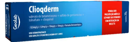
9367-Clioqderm Cr. 20g Beta+genta+tolnaf+clioq. Referência: Quadriderm