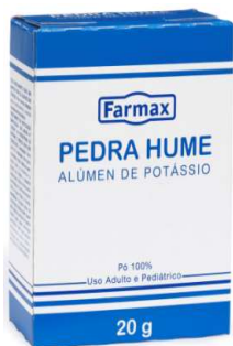
0458-Pedra Hume c/12 8225-Pedra Hume spray c/ glicerina 30ml