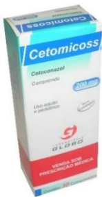
826-Cetomicoss creme 20g Cetoconazol Referência: Nizoral