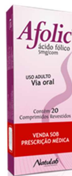
8790-Afolic 5mg c/20 Ácido fólico Referência: Endofolin