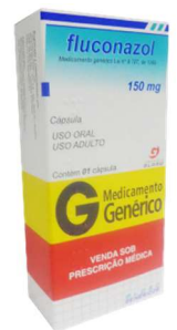
8946-Fluconazol 150mg c/1 8947- Fluconazol 150mg c/2 Referência: zoltec