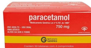
8150- Paracetamol 750mg c/50x4