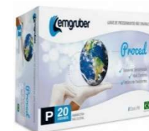
10145-Luva proced.latex P não esteril c/20 unds c/pó 10146- Luva proced.latex G não esteril c/20 unds c/pó 10158- Luva proced.latex M não esteril c/20 unds c/pó 10429- Luva cirurg.esteril latex c/pó par T-7,0 10430- Luva cirurg.esteril latex c/pó par T-7,5