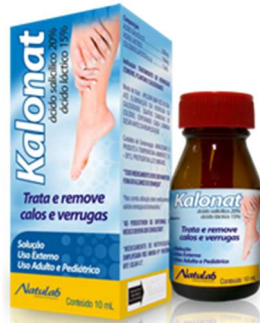
5111- Kalonat 10ml Ácido s. láctico Referência: Kalloplast