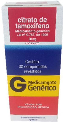
9865-Citr.de Tamoxifeno 20mg c/30 Referência: Nolvadex