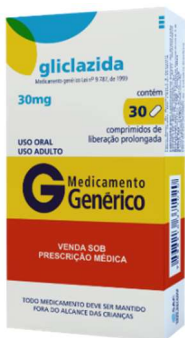
8841- Gliclazida 30mg c/30 9410- Gliclazida 30mg c/60 10314- Gliclazida 30mg c/30 Lib. prolongada 10315- Gliclazida 60mg c/30 Lib. prolongada Gliclazida Referência: Diamicon