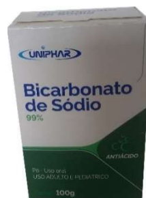
10222-Bicarbonato de sódio 100g 10464-Bicarbonato de sódio 50g Uniphar