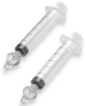
11100- Seringa p/lavagem nasal 10ml c/2 HC398 Multilaser