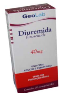
7289-Diuremida 40mg c/20 Furosemida Referência: Lasix