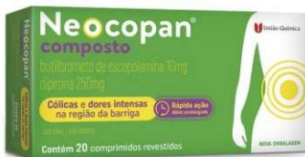
10876-Neocopan c/20 Escopolamina+Dipirona Referência: Buscopan Composto