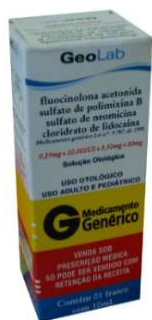
6947-Fluocinolona poli +neomicina+ lidocaína 10ml Otológico. Referência: Otosynalar