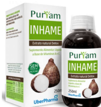
6199-Elix inhame Puryam 250ml