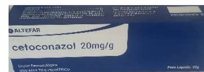
10944-Cetoconazol cr 30g Referência: Nizoral