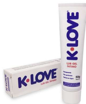
11138-K. love lubrificante gel 50g