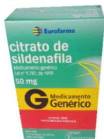
9909-Sildenafil 50mg c/2 9910-Sildenafil 50mg c/4 Referência: Viagra