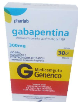
9919-Gabapentina 300mg c/30 Referência: Neurontin