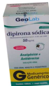
6154-Dipirona sol 100ml sabor cereja Referência: Novalgina