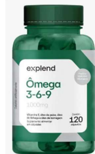
11142-Omega 3,6,9 homem c/120 caps Explend