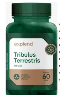
10959-Tribulus terrestres 500mg c/60 caps Explend