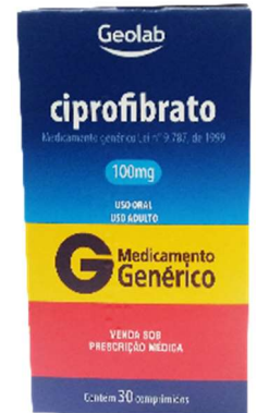
8939-Ciprofibrato 100mg c/30 Referência: Oroxadin