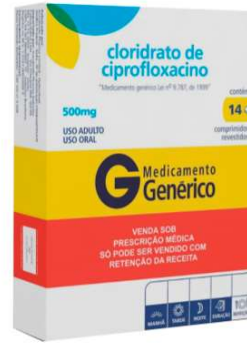
8131-Ciprofloxacino 500mg c/14 Referência: Cipro