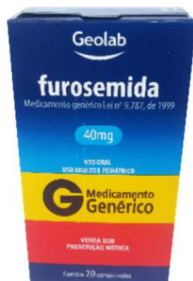
9276-Furosemida 40mg c/20 Referência: Lasix