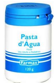
0498-Pasta d'Água 120g pote 4116-Pasta d'Água 120g bisnaga