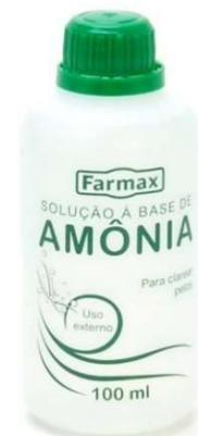
3089-Amonia 100ml c/ 12