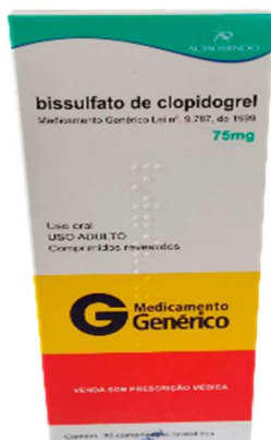
9190-Clopidogrel 75mg c/30 Referência-Plavix