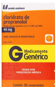
10833-Propranolol 40mg c/30 Clor. De Propranolol Referência: Meticorten