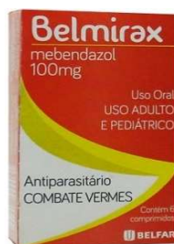
4042-Belmirax c/6 Mebendazol Referência: Pantelmin