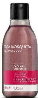
9850-Óleo de rosa mosqueta capilar e corporal 100ml 10038- Óleo de rosa mosqueta puro 30ml 11078- Óleo de rosa mosqueta puro corporal 60ml