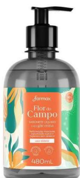
11204-Sabonete liq. Encantos da Natureza 480ml 11205-Sabonete liq. Flor do Campo 480ml 11208-Sabonete liq. Riquezas da Floresta 480ml