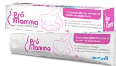
10354-Promamma (lanolina anidra purificada) 30g