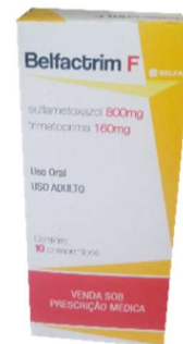
9544-Belfactrim F 800mg+160mg c/10 263-Belfactrim 400mg+80mg c/20 sulfametoxazol+Trimetoprima Referência: Bactrin