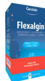
8310-Flexalgin 10x10 8300-Flexalgin c/15 6130-Flexalgin 25x4 6613-Flexalgin c/ 30 Cafeína, Carisopradol Diclo sódico, Paracetamol Referência: Tandrila