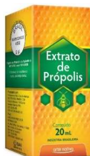
8824-Extrato de Própolis 20ml