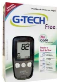
6233- Aparelho Medidor de glicose 8775- Aparelho Medidor de glicose free lite G.Tech