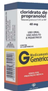
11172- Propranolol 40mg c/30 Clor. propranolol