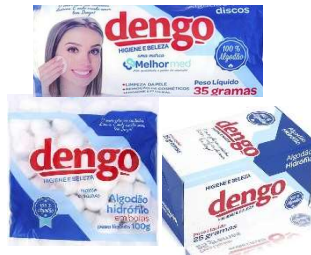
9852-Algodão disco dengo 35g 9851-Algodão hidrófilo dengo 25g cx 10033-Algodão hidrófilo dengo 50g cx 10032-Algodão hidrófilo bola dengo 100g 9853-Algodão hidrófilo bola dengo 50g Melhor Med