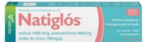
5738- Natiglós pda vitamina A e D 45g Referência: Hipoglos