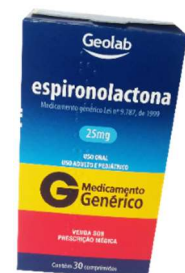
9650-Espironolactona 25mg c/30 9912-Espironolactona 50mg c/30 Referência: Aldactone