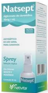
6560- Natsept spray 50ml Referência: Merthiolate