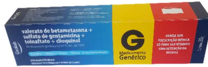
9366-Beta+genta+tolnaf+clioq. Cr. 20g Referência: Quadriderm