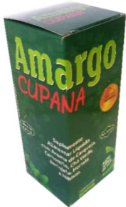
1951-Amargo Cupana (Suplemento) 500ml