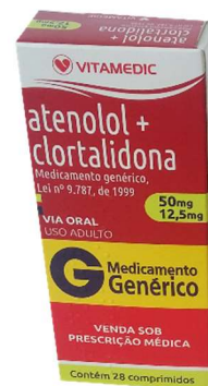
9677-Atenolol+clortalidona 100+25mg c/28 9678-Atenolol+clortalidona 50+12,5mg c/28 Referência: Tenoritic