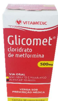
9979-Glicomet 500mg c/30 10151-Glicomet 850mg c/30 Metformina Referência: Glifage