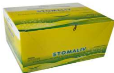
7556-Stomaliv eferv. c/ 10x5g 7233-Stomaliv eferv. c/ 50x5g 9653-Stomaliv eferv. c/ 50x5g Bicarbonato sódico+Carbonato sódico+Ácido cítrico Referência: Estomazil