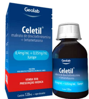
7281-Celetil 120 ml Dexcl+ Betametasona Referência: Celestamine