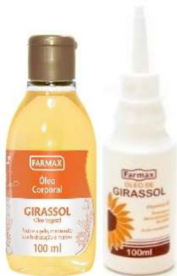
5761-Óleo de girassol 100ml 9765-Óleo de girassol 200ml 8340-Óleo de girassol corporal 100ml