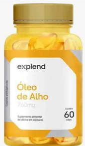
11000-Oleo de alho 760mg c/60 caps Explend