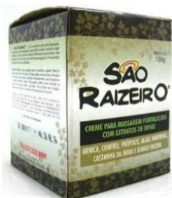
8188-São Raizeiro creme Massagem 135g