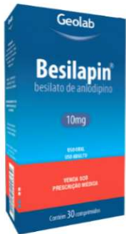
7375-Besilapin 10mg c/30 7376-Besilapin 5mg c/30 Anlodipino Referência: Norvasc