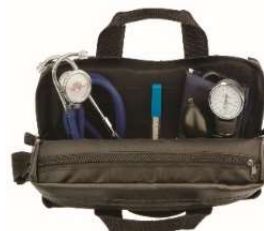
5679-Apar pressão kit Acadêmico completo Premium