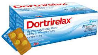
8782-Dortrirelax c/ 30 10165-Dortrirelax c/ 20X10 Dipirona, cafeína, orfenadrina Referência: Dorflex