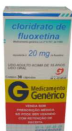
8251-Fluoxetina 20mg c/30 Referência: Prozac