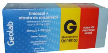
8089-Tinidazol+Miconazol cr vg 45g c/ 07 aplicadores Referência: Gino-Pletil