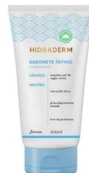
10041-Sabonete íntimo neutro hidraderm 200ml 10669-Sabonete íntimo fresh hidraderm 200ml