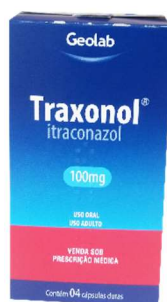
6125-Traxonol 100mg c/4 6126-Traxonol 100mg c/15 Itraconazol Referência: Sporanox