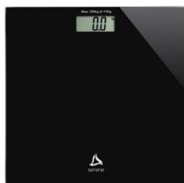
8660-Balança digital Prata 8661-Balança digital Preto Serene