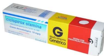
5219-Ciclopirox Olamina creme 20g Referência: Loprox