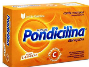
10736-Pondicilina past laranja c/12 10686-Pondicilina past menta c/12 Vitamina C+Mentol