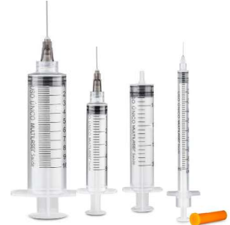
11157-Seringa 10ml c/ag lock c/ 100 HC451 11158-Seringa 10ml s/ag lock c/ 100 HC453 11161-Seringa 1ml ins ag 12x0,32 c/ 100 HC459 111092-Seringa 1ml ins slip s/ag c/ 100 HC442 11159-Seringa 20ml s/ag lock c/ 50 HC455 11160-Seringa 20ml s/ag slip c/ 50 HC456 11093-Seringa 3ml c/ag 30x7 look c/ 100 HC443 11158-Seringa 3ml s/ag lock c/ 100 HC445 11095-Seringa 3ml s/ag slip c/ 100 HC446 11162-Seringa 5ml c/ag 30x7 look c/ 100 HC447 11096-Seringa 5ml s/ag lock c/ 100 HC449 11097-Seringa 5ml s/ag slip c/ 100 HC450 Multilaser