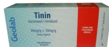
8298-Tinin cr vg. 35g c/7 apli. Tioconazol+Tinidazol Referência: Cartrax