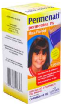
4017-Permenati 1%) 60ml 8504-Permenati 5%) 60ml Permetrina Referência: Kwell