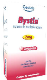
6127-Hystin c/20 6128-Hystin liq 120ml Dexclorfeniramina Referência: Polaramine