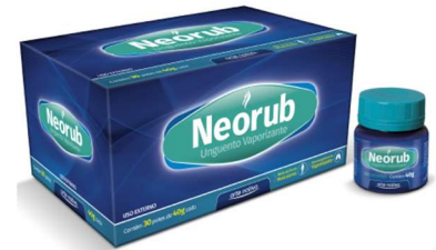
9296-Neorub c/12 9293-Neorub 40g Referência: Vicky