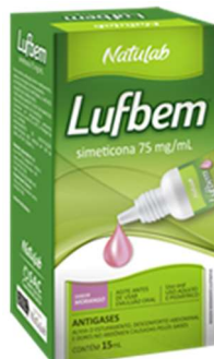
9287- Lufbem gts 15ml Simeticona Referência: Luftal