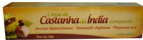
7383-Castanha da Índia composta creme 60g