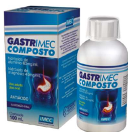
10215-Leite de magnésia gastrimec 100ml