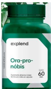
10960-Ora pro nobis 500mg c/60 caps Explend