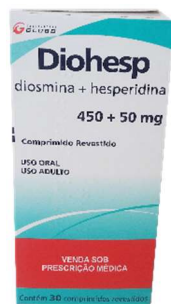
9825-Diohesp c/30 9826-Diohesp c/60 Diosmina+hesperidina Referência: Daflon