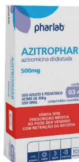
3639-Azitrophar 500mg c/3 3765-Azitrophar 600mg 3705-Azitrophar 900mg Referência: Zitromax