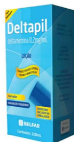
93-Deltapil loção 100ml 72-Deltapil xpu 100ml Deltametrina Referência: Deltacid