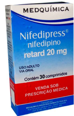
2885-Nifedipress retard 20mg c/30 Referência: Adalat retard