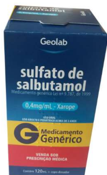
8342-Salbutamol 120ml Referência: Aerolin